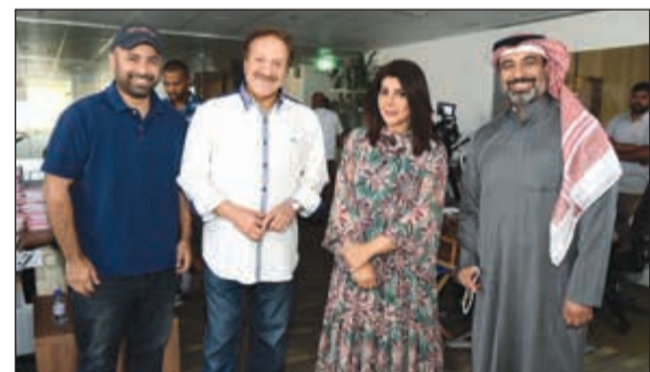
نجوم مسلسل «روتين»

إنجاز إعلامي وعالمي تحقق عبر سواعد كويتية وطنية بعد اختيار شركة أبل تطبيق «تيلي» ضمن أفضل تطبيقات عام 2017 في «أب ستور». ويشهد شهر رمضان الحالي 2018 انفراد «تيلي» حصرياً بثت المسلسلات الكويتية الرمضانية على شاشة تلفزيون الكويت بمشاركة أكبر عدد متميز من نجوم الكويت ودول مجلس التعاون الخليجي. بالإضافة إلى بقية المسلسلات والبرامج التي يقدمها تلفزيون الكويت ومنها مسلسل «روتين» و«الخافي اعظم» و«مع حصه قلم» و«عبرة شارع» و«بلوك غشمرة» و«سموم - المعزب 2» وغيرها من أحدث نتاجات تلفزيون الكويت التي ستعرض حصرياً على تطبيق «تيلي». الجدير بالذكر أن «تيلي» يمثل إضافة إلى رصيد الكويت والإعلام الكويتي الذي استطاع أن يذهب بعيداً في استراتيجيته التي تعتمد الاستثمار في أحدث التطبيقات التي تؤمن خدمات إعلامية وفنية عالية الجودة والانطلاق إلى آفاق عالمية أوسع وأبعد وتأمين جسر للإبداع الكويتي للانطلاق عالمياً.