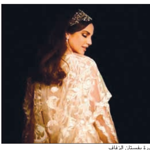
درة بفستان الزفاف