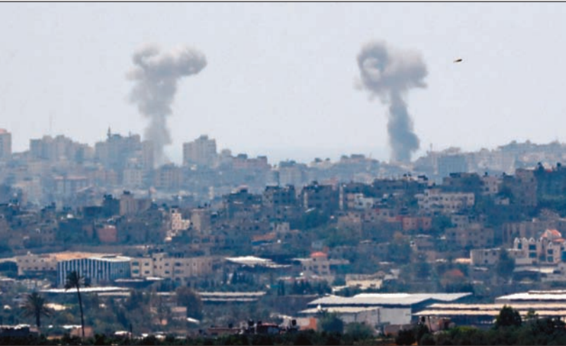
دخان كثيف يتصاعد في سماء غزة إثر الغارات الإسرائيلية على القطاع

الهدوء الحذر يعود إلى القطاع بعد وساطة مصرية