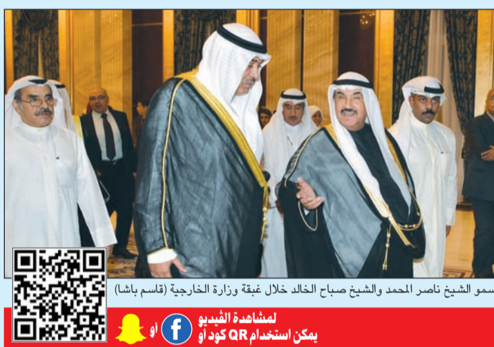
سمو الشيخ ناصر المحمد والشيخ صباح الخالد خلال غبقة وزارة الخارجية