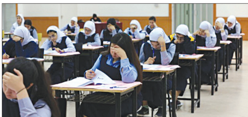
طالبات «ثانوية العبدان» لدى أداء اختبار مادة الأحياء

عبدالعزیز الفضلي أعلن وزير التربية وزير التعليم العالي د.حامد العازمي السماح لفتات الراغبين في العودة إلى العمل في سلك التعليم من المواطنين الذين تم تحويلهم إلى العمل الإداري بناء على رغبتهم الشخصية، وذلك بشرط ألا يكون مضى على قرار تحويلهم إلى العمل الإداري عام ميلادي. من جهة أخرى، يسدل اليوم الستار