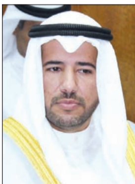
الشيخ عبدالله الأحمد

وقال الأحمد في تصريح لـ «الأبناء» أنه تتم حالياً دراسة المخزون السمكي وأسباب انخفاض الأسماك في البحر والإجراءات اللازمة للحد من تدهور الثروة السمكية من جانب المختصين في الدولة خاصة بعد النتائج والتوصيات التي توصلت إليها الدراسة الخاصة بأسباب تدهور المخزون السمكي. وحول حالات نفوق الأسماك المتفرقة التي حصلت بداية الشهر الجاري، قال الأحمد إن الهيئة رصدت طحالب ضارة في جون الكويت، ويعد ذلك من