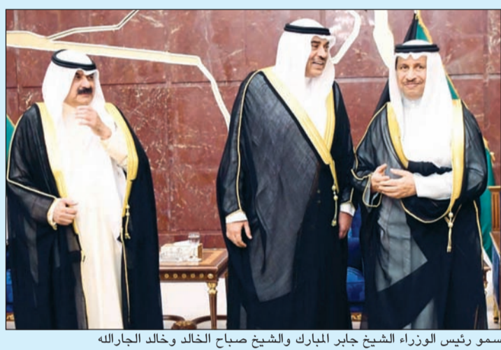
سمو رئيس الوزراء الشيخ جابر المبارك والشيخ صباح الخالد وخالد الجارالله

صفتها خلال القمة الأميركية-الخليجية في سبتمبر المقبل. وذكر أن زعيم التيار الصدري العراقي مقتدى الصدر رقم مهم جداً في المعادلة السياسية بالعراق وزيارته لكويت محل ترحيب، مشيراً إلى التنسيق مع الأشقاء والأصدقاء حول مشروع القرار الذي ستقدم به الكويت في مجلس الأمن لتوفير الحماية الدولية للشعب الفلسطيني.