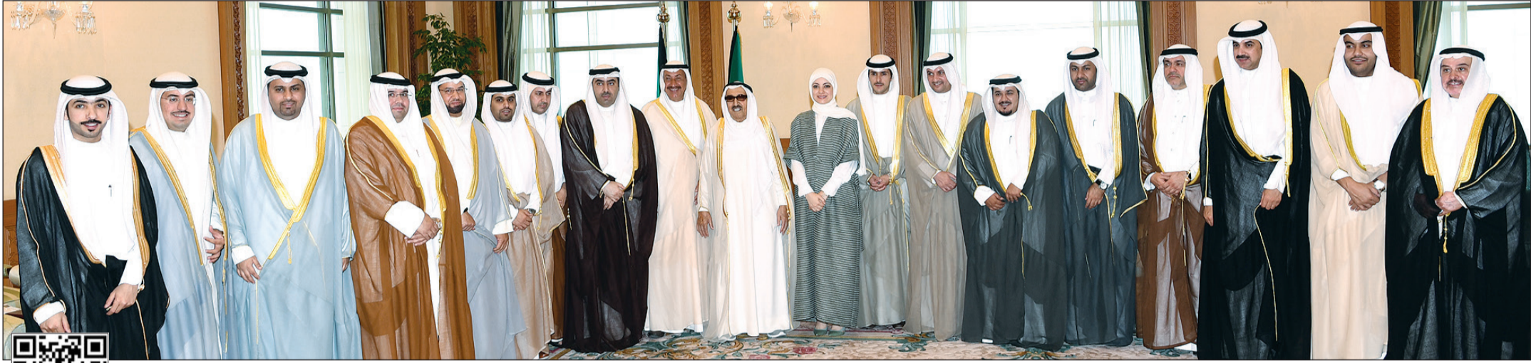
صاحب السمو الأمير الشيخ صباح الأحمد متوسطاً م.حسام الرومي وأسامة العتيبي وأعضاء المجلس البلدي

ولي العهد: ضرورة تسريع وتيرة النهضة العمرانية والمشاريع الخدمية التي تشهدها كويت المستقبل