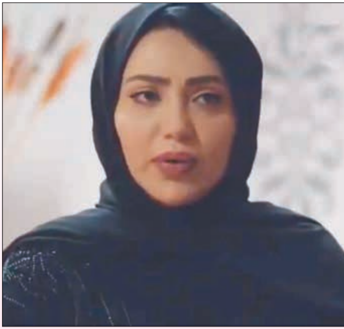
فوز الشطي وظهور مميز في شخصية «حصّة»