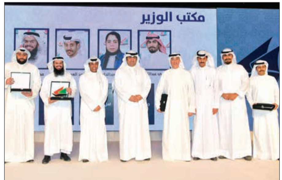
الروضان مكراً بعض موظفي مكتب الوزير

سجل أقل من 1% بنهاية مارس الماضي في الكويت