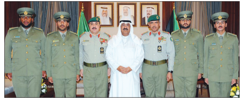
الشيخ مشعل الأحمد والفريق الركن هاشم الرفاعي واللواء الركن فالح شجاع مع الخريجين

استقبل نائب رئيس الحرس الوطني الشيخ مشعل الأحمد في ديوانه بالرئاسة العامة للحرس الوطني وكيل الحرس الوطني الفريق الركن م. هاشم الرفاعي والذي قدم له خريجي كلية الملك خالد العسكرية بالملكة العربية السعودية الشقيقة. ونقل الشيخ مشعل الأحمد إلى الخريجين تهنئة سموه رئيس الحرس الوطني الشيخ سالم العلي بانضمامهم إلى إخوانهم في الحرس الوطني، ودعاهم إلى الالتزام والانضباط وبذل الغالي والنفيس من أجل الحفاظ على أمن الوطن، ودعا الشيخ مشعل الأحمد الضباط الخريجين لبذل الجهد والعطاء والتزود بالعلم والمعرفة