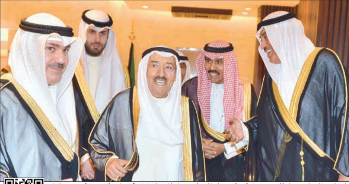
صاحب السمو الأمير الشيخ صباح الأحمد وسمو ولي العهد الشيخ نواف الأحمد لدى وصولهما إلى وزارة الخارجية وفي استقبال سموهما الشيخ صباح الخالد

■ نستذكر بالفخر والاعتزاز دور هذا الكيان السياسي العريق الذي كان ولا يزال أحد مراكز تخريج شخصيات متميزة من سفراء ورجال دولة وشهداء ضحوا بأنفسهم في سبيل الوطن ■ بلدنا استحق وبكل جدارة تسميته مركزاً للعمل الإنساني والكويت تسعى دوماً لمد يد العون للدول وتقديم المساعدات لكل محتاج ■ صندوق التنمية الذراع الرئيسية للدبلوماسية الكويتية فضلاً عن المؤسسات الخيرية الأخرى مستلهمة بذلك مبادئ ديننا الإسلامي الحنيف والإرث الكبير للأجيال السابقة 02 03