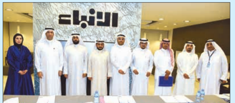
المشاركون في ندوة «الأنباء» (أحمد علي)