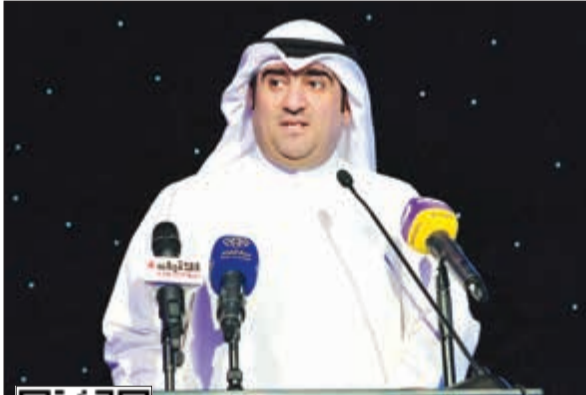
خالد الروضان متحدثاً خلال الغيبة الرمضانية (قاسم باشا)

أكد وزير التجارة والصناعة خالد الروضان أن الوزارة حققت الرقم الأعلى في تاريخها بقطاع شؤون الشركات والتراخيص التجارية، من خلال إصدار أكثر من 12 ألف رخصة تجارية، لتتجاوز بذلك خلال سنة واحدة مجموع سنوات كثيرة سابقة. وأضاف الروضان في كلمته، خلال الغيبة الرمضانية التي أقامتها وزارة التجارة مساء أول من أمس وتخللها تكريم الموظفين المتميزين، أن «التجارة» كانت أكثر وزارة أقرت تشريعات برلمانية بنحو 4 تشريعات خلال دور الإنعقاد، وهو رقم كبير، ناهيك عن قدرتها على تطوير الكثير من الخدمات وحل العديد من المشاكل. وقال «نقف اليوم وخلفنا رصيد من الأرقام القياسية التي