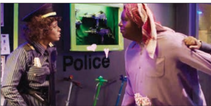
مشهد من بات نايت