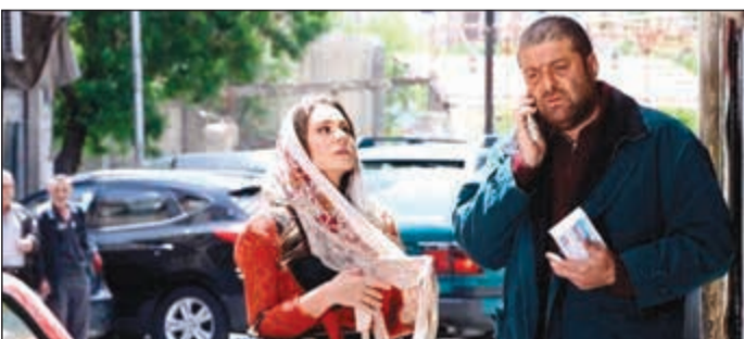
لقطة من مسلسل «فوضى»

لما شفت انتايتة!! ليرد عليها: الله يرضى عليك سدي بوزك.. بصراحة خووووش حوارات.