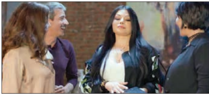
مشهد من «لعة كارما»

الحلقة الاولى وحوالي مليوناً في الحلقة الثانية ويفارق بعيد جدا عن بقية النجمات المنافسات كغادة عبد الرزاق ونيللي كريم ويسرا وغيرهن..