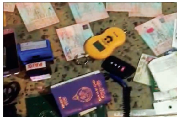
هويات ومستندات مزورة