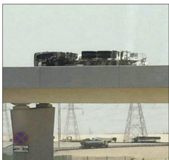
الشاحنة بعد انقلابها على الجسر