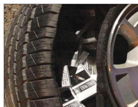
استبدال الهواء بالسجائر في الإطارات