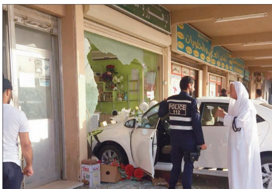
المركبة وقد اتلفت واجهة المحل