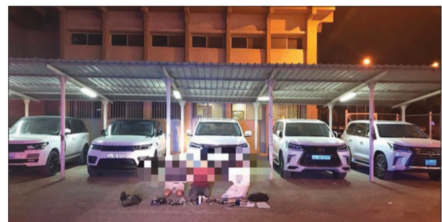
المركبات التي تم العثور عليها

سجل قطاع الأمن العام بقيادة اللواء إبراهيم الطراح وكيل القطاع إنجازاً غير مسبوق بعد أن تمكن من ضبط عصابة من السوريين احترفت سرقة مركبات فاخرة وحديثة من موديلات تبدأ من 2008، وتصل قيمتها السوقية إلى 150 ألف دينار، وذلك بطريقة مبتكرة تتمثل في استئجار المركبات من مكاتب لتأجير السيارات لمدة يوم واحد وما ان يتسلم احد أعضاء العصابة المركبات حتى يقوم بإلغاء أنظمة التتبع بحيث لا يتمكن صاحبها من الاستدلال عليها فيما كشفت التحقيقات ان المتهمين كانوا يصدون تفكيك السيارات وبيعها كقطع غيار، الا ان رجال الأمن العام واطلاقاً من انتشارهم للاتق، تمكنوا من الإيقاع بأفراد التشكيل العصابي الواحد تلو الآخر،