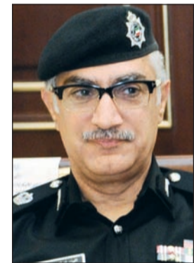
اللواء إبراهيم الطراح