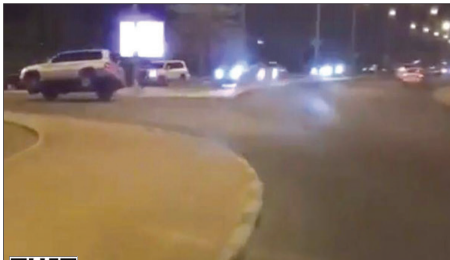
المركبة الرباعية تسير على إطارين في الرقة ورصدتها ناشط وبثها على التواصل