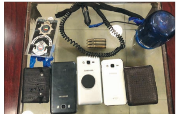
فلاشر وهواتف نقالة وهويات عسكرية