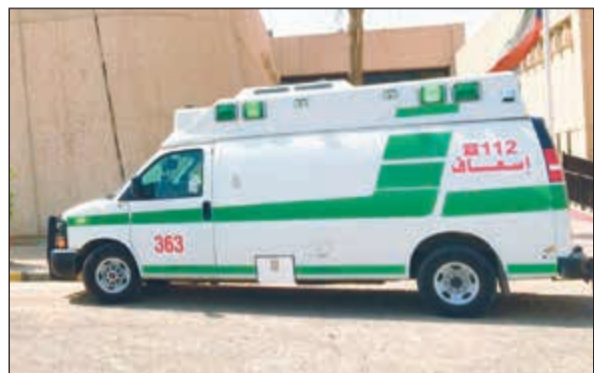
إحدى سيارات الإسعاف أمام مبنى وزارة التربية

عنف وشغب طلابي في لجان «الجهراء» الثانوية