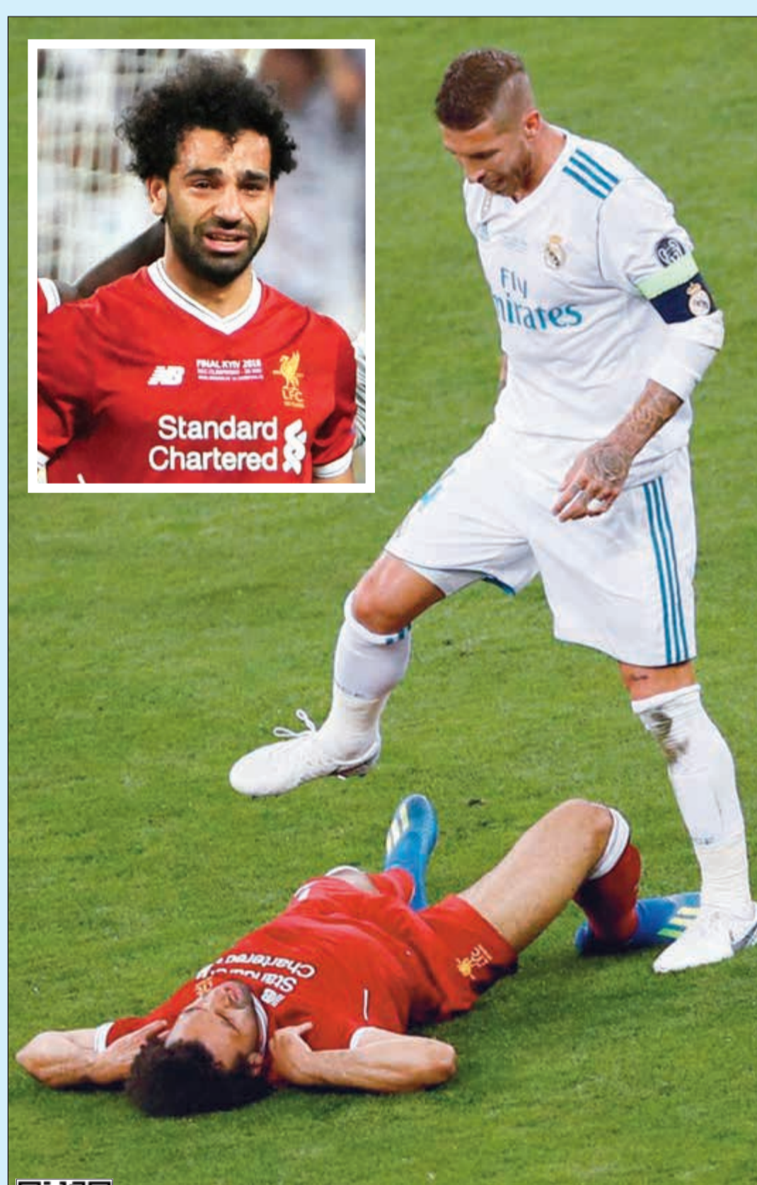
محمد صلاح متألماً بعد تدخل راموس العنيف.. وفي الإطار دموع الغياب عن بقية نهائي الأبطال

تعد لجنة الداخلية والدفاع عدتها للمباشرة في دراسة قضية تعديل قانون الانتخاب من حيث تعديل الدوائر وعدد الأصوات والتوزيع الجغرافي والمناطق وفقاً للكثافة السكانية، وذلك استناداً إلى تكليف المجلس. وفي هذا الإطار أكد عضو اللجنة النائب نايف المرادس في تصريح لـ «الأنباء» أن اللجنة لاتزال في انتظار رأي الحكومة في الاقتراحات المقدمة والمتعلقة بتعديل الدوائر الانتخابية «وحتى هذه اللحظة لم يصلنا شيء». وفي هذا السياق أشار مصدر نيابي لـ «الأنباء» إلى أن