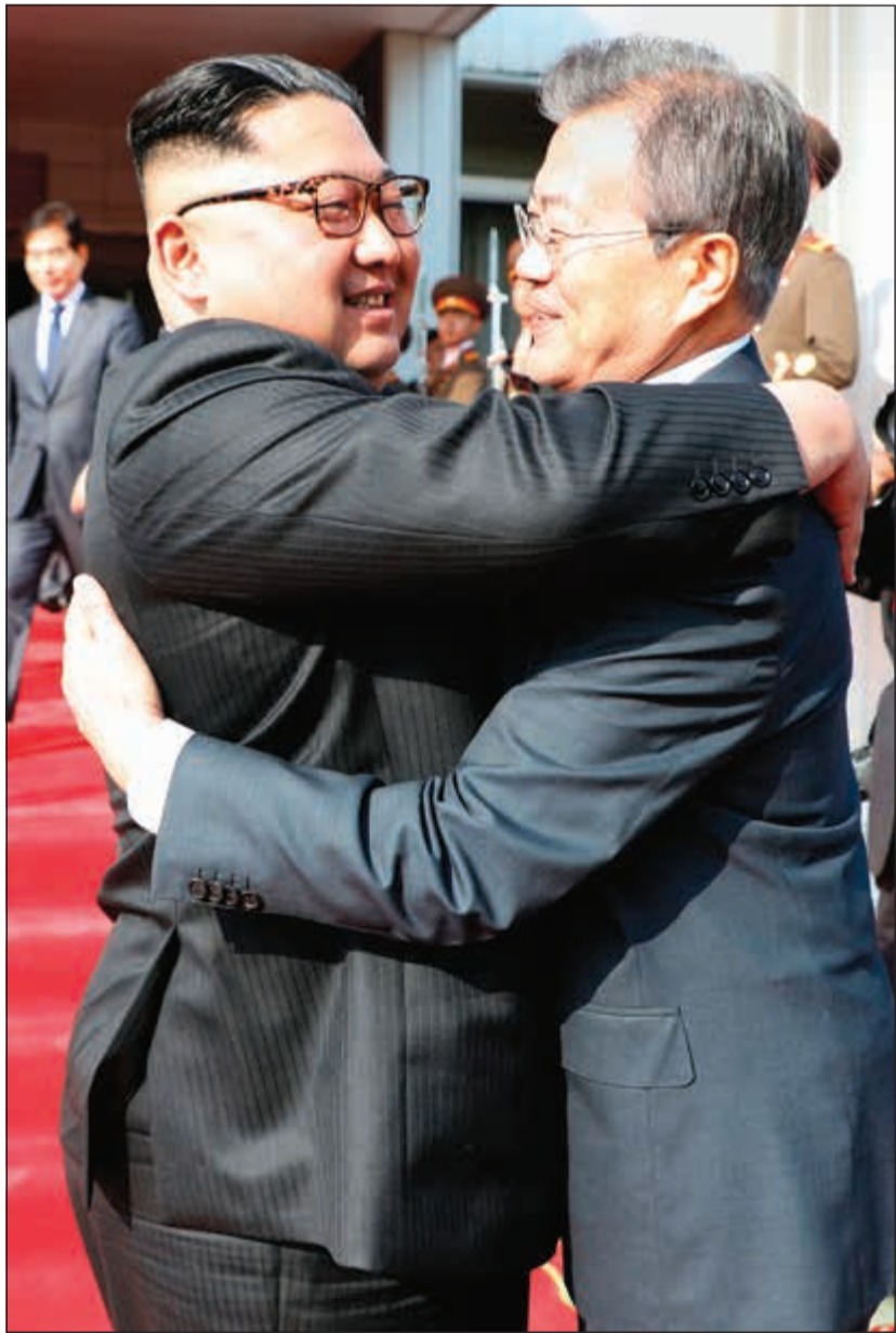
عناق حار بين زعيم كوريا الشمالية كيم جونج أون ونظيره الكوري الجنوبي مون جيه إن أمس