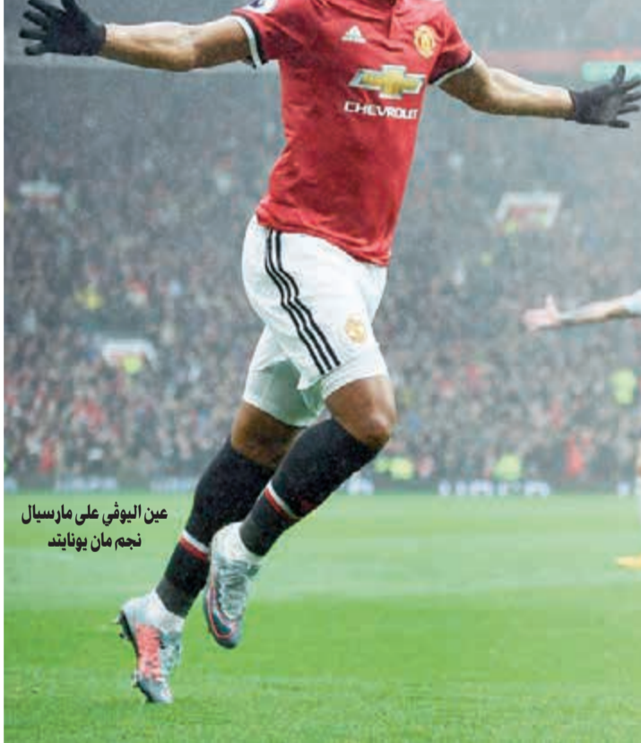
عن البوغي على ماريال نجم مان يونايتد

نجح يوفنتوس في التتويج بلقب الدوري الإيطالي بعد موسم طويل شهد منافسة قوية، حتى الجولات الأخيرة للمرة الأولى منذ عدة سنوات.