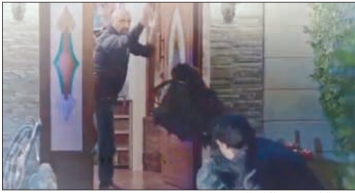
مشهد الطرد في محطة انتظار

أغراضه خارج الشقة قال له بالإنجليزي «...take your sh...» يا رقابة ركزوا على الكلام.. مو اي كلام إنجليزي !ok