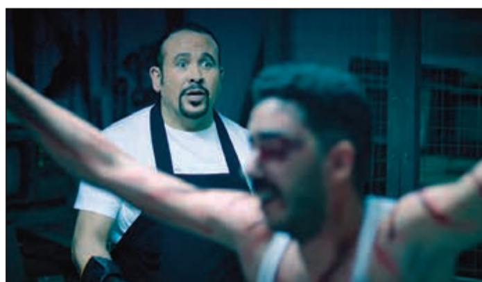
هشام عباس بمسلسل «الوصية»

كضيف شرف ظهر الفنان هشام عباس بطريقة تميز فيها بكونه مبدع وقفاشته في مسلسل «الوصية»، وهو يقوم بتعذيب