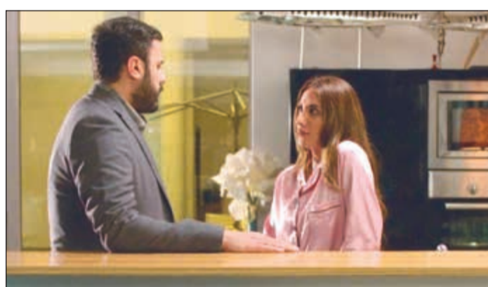
بوشهري مع روان في المسلسل

انسانيا بعد انتشار فيروس قاتل فيها لترد عليه زوجته «شكك وايد مستعجل على الجنة وانا مالي شغل في الخرابيط».. شالحجي!