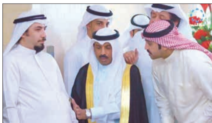
مسلسل واحد مهم

اللي فيه تصلح للمسرح وما تصلح تكون في مسلسل تلفزيوني.. خيرا غيرها!