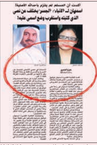
صورة لخبر «الأنباء» المنشور بتاريخ 2018/5/26