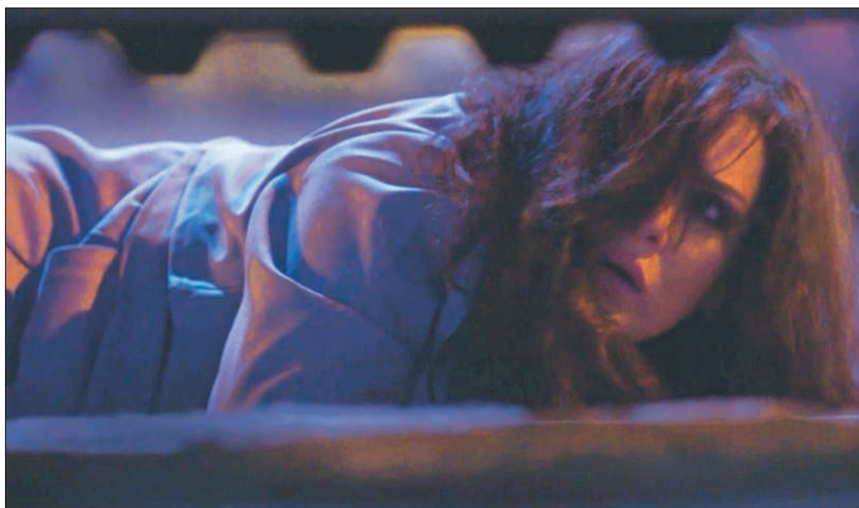
هبة الدري في لقطة من المسلسل

مسلسله العام الماضي «إقبال يوم أقبلت» وخاصة تمحوره حول شخصية مركزية واحدة هيمنت على الغالبية الساحقة من المشاهد. ففي هذا الموسم، نحن أمام سيناريو متوازن ومختلف وسليم تماماً حد الأحكام. البطلة الرئيسية الفنانة سعاد عبدالله تظل بشخصية مغيرة للاهتمام «شكلاً ومضموناً»، حيث أتاح لها قالب «انتصار» التاللق بأناقته واستنهاض طاقاتها التمثيلية لتؤدي دوراً تذب فيه وتشخصه بأدق تفاصيله، المرأة القوية العنيدة المتمردة المحبة للحياة والمال والتي ترفض المعايير بالسن وترى أن العمر لم يسرق جمالها. تحيلنا سعاد عبدالله وهي تجسد دور «انتصار» إلى حضور وكاريزما النجمة العالمية «ميريل ستريب» التي تشبهها في كثير من الملامح في الشخصية والانصهار في الشخصية مهما بلغت صعوبتها. وإلى جانب «انتصار»