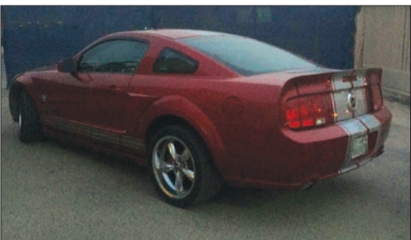
أحدى المركبات التي تم حجزها