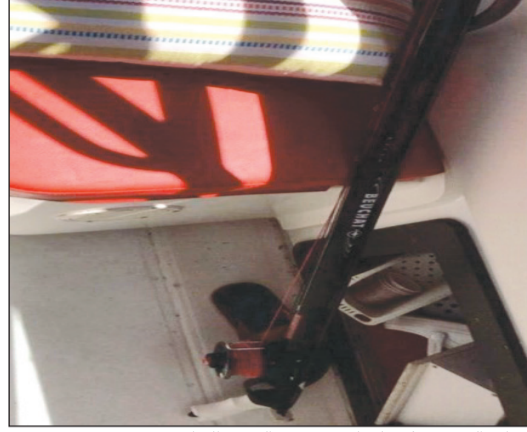
أدوات الصيد عثر عليها في 21 من الشهر الجاري