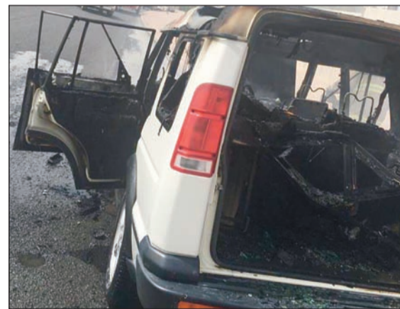
النيران اتت على محتويات المركبة