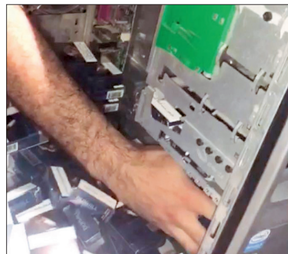
الاسويي اخفى السجناء في عدد 2 هارديسك