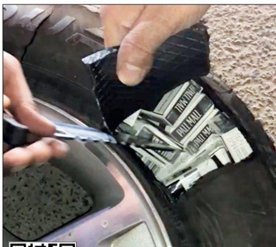
والخليجي استبدل الهواء بالسجناء في الإطار