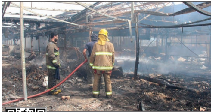
الحريق تسبب في اتلاف كامل لجزء كبير من المشتمل