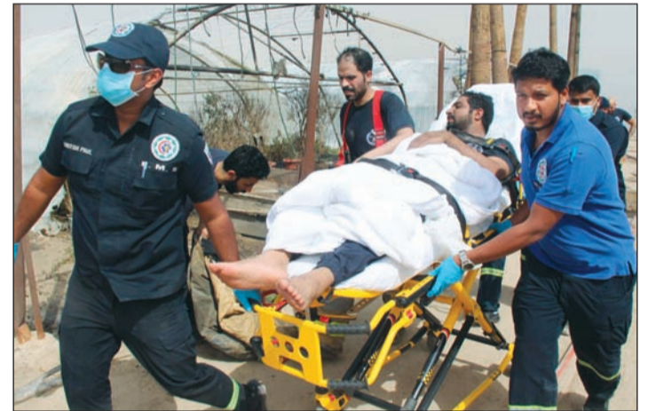
أحد رجال الإطفاء في طريقه إلى المستشفى بعد إصابته في حريق المشتمل