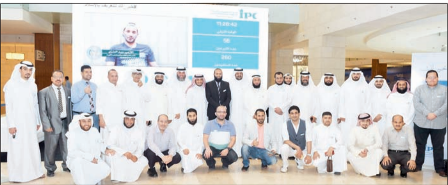
أعضاء اللجنة والمشاركون في الحملة في لقطة جماعية (مقتن غوزال)

المهتدين وهم بحاجة شديدة لمن يعلمهم الوضوء والطهارة والصلاة وأركان الإسلام وأركان الإيمان والفقه والسيرة والحديث وغيرها من الأمور الدينية.