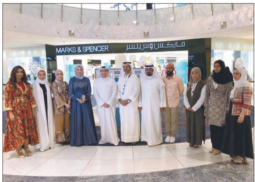
م. محمد بوشهري متوسلا عددا من المشاركين في معرض كفاءة بجمع 360

أكد وكيل وزارة الكهرباء والماء م. محمد بوشهري أن الوزارة تولى أهمية خاصة للفحوصات المخبرية للتأكد من جودة المياه حيث تستخدم أكثر الأجهزة تطوراً في هذا الشأن. وقال بوشهري خلال زيارته المعرض التوعوي الذي تنظمه مجموعة كفاءات في مجمع 360 ان الوزارة بمختلف قطاعاتها وأجهزتها تسعى للتواصل مع جمهور المستهلكين بهدف توعيتهم بأهمية المحافظة على موارد الدولة كالكهرباء والمياه. وشدد على أهمية المحافظة على موارد الدولة والحفاظ عليها للأجيال المقبلة وذلك بشتى الطرق المتاحة. وقال ان المعرض خصص للحديث عن المياه وكيفية إنتاجها والحفاظ عليها من الهدر، لافتا الى ان هدف الوزارة من ذلك توضيح الجهود المبذولة في إنتاج المياه وتخليتها من مياه البحر لتصل صالحة للشرب الى منازل المستهلكين والمرحل التي تمر بها هذه العملية التي تتطلب جهدا ومالا ومن واجب الجميع الحفاظ عليها. وأوضح ان شرح كيفية استخدام مياه البحر وتحويلها الى مياه صالحة للشرب ووضع لوحات توضح لاطفال عمل الوزارة في إنتاج المياه يهدف الى مشاركة الجميع بعمل الوزارة. كما اشار الى وضع الأجهزة الخاصة بفحص المياه والتأكد من جودتها وكذلك معلومات عامة عن كيفية ترشيد المياه لزوار المعرض.