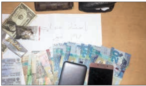
أكياس المخدرات والأموال التي ضبطت مع المواطنين