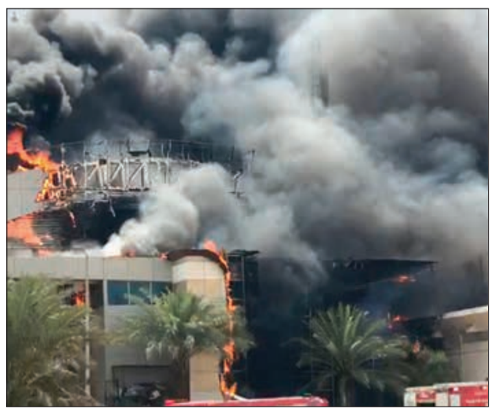
صورة أرشيفية من حريق جمعية هدية