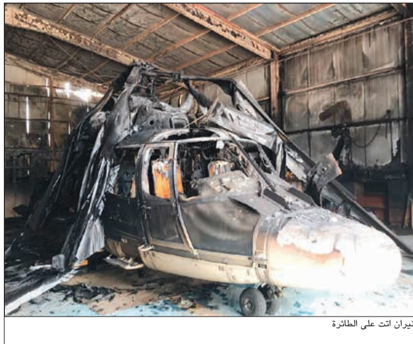
النيران انت على الطائرة

أجاز المعاملات لمن تصدر له بطاقة لـ 6 أشهر حتى وإن كان الباقي من صلاحيتها شهراً