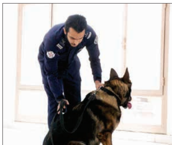
اختبارات المفتشين الجدد

تقنيات التفتيش ورفع كفاءة المفتشين باستخدام كل السبل من أدوات مساعدة وأجهزة متقدمة، وبما يحقق أقصى درجات الأمن الجمركي.