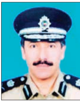
اللواء عابدين العابدين

لاحقا انهما مواطنان، وبتفتيشهما عثر معهما على مواد مخدرة ومبالغ مالية. وفي منطقة جنوب السرة، تم توقيف مواطنين آخرين وعثر بحوزتهم على مواد مخدرة، من جهة أخرى، ضبط وافدان احدثما أردني والأخر مصري، حيث اشتبهت احدي الدوريات في الأول بعد ان ظهرت عليه علامات الارتباك فور مشاهدته للدورية، وبتفتيشه احترازيا عثر معه على 3 اكياس شبو مخلوطة بالكيميال، أما الوافد المصري فقد تم ضبطه في منطقة الجابرية وبحوزته كيس به كيميال.