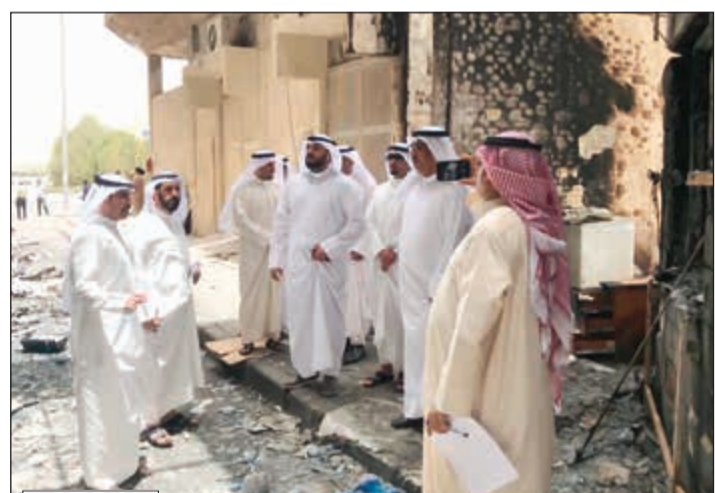
الشعب ومجلس الإدارة يتفقدون آثار الحريق