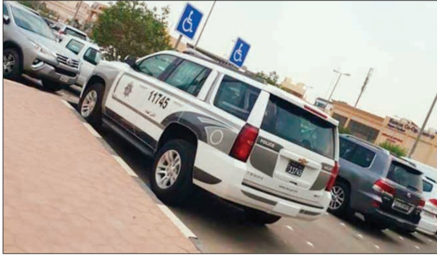
الدورية متوقفة في مواقف المعاقين

وبحسب مصدر أمني، فإن وسائل التواصل نشرت صورة للدورية وهي متوقفة في مواقف المعاقين، وعلى الفور قام اللواء الطراح بتحديد جهة عمل الدورية وتبين أنها تتبع الشرطة المجتمعية، وجرى تحديد قائد الدورية وتبين أنه عريف وصدر أمر بحبسه.