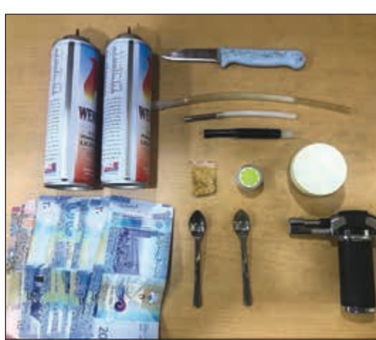
المخدرات وأدوات التعاطي

جاسم التيب في إطار الانتشار الأمني الذي وجه به مدير امن حولي اللواء عابدين العابدين بهدف حفظ الامن في جميع المحافظات، تمكن رجال أمن حولي من توقيف 10 مطلوبين بينهم 6 مواطنين و4 وافدين، ففي منطقة النفرة تم توقيف شخص تبين لاحقاً انه مواطن وبعد الاستعلام عنه تبين انه صادر بحقه 3 أوامر إلقاء قبض مدين بمبالغ يصل إجمالها الى 14,500 دينار. وفي منطقة السلمية تم