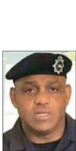
اللواء صالح مطر

الطراح رصدت متسولا بالقرب من أحد المساجد وعند الاقتراب منه حاول الفرار وتمت ملاحقته والسيطرة عليه، وتبين أنه وأحد من الجنسية اليمنية، وبعد الاستعلام عنه اتضح أنه دخل البلاد بطريقة غير مشروعة منذ عدة اشهر، وعليه امر اللواء صالح مطر بحالته الى امن الدولة للتحقيق معه، واضاف المصدر أن رجال الامن عقروا مع المتهم على مبلغ ارفق بالتقرير الذي رفع الى الجهات المختصة.