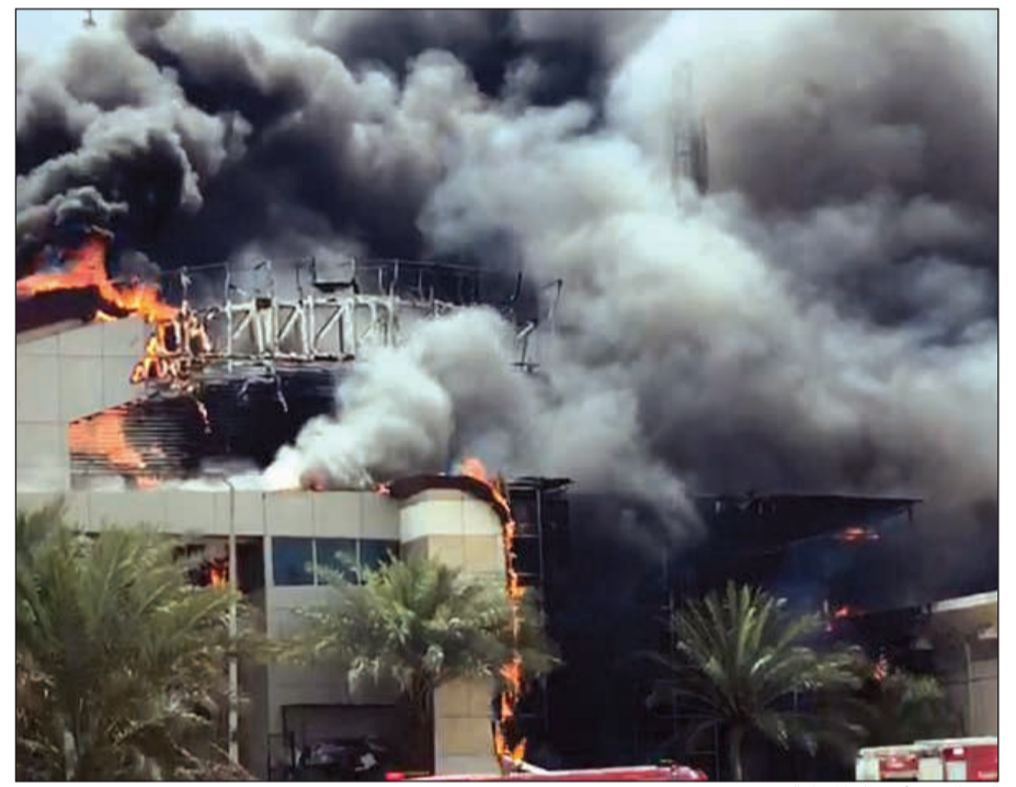
الدخان يملأ سماء المنطقة

يمكن استخدام QR كود أو مشاهدة الفيديو على الفيسبوك أو سناب شات