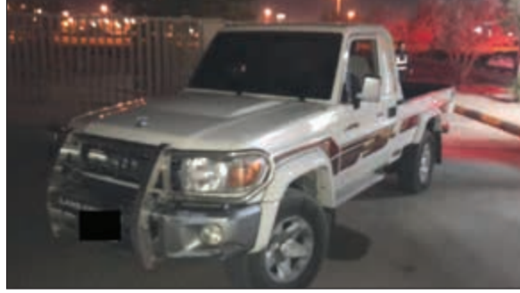
سيارة مخالفة ضبطها رجال الأمن العام