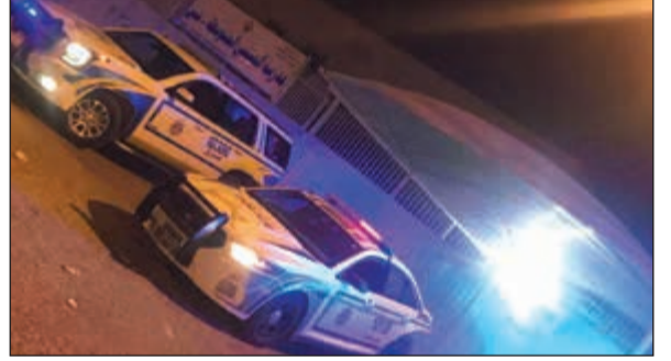
مقطع لأحد الاستعراضات

العام من ضبط مستهتر جديد قام بعمليات الاستهتر والرعونة في منطقة صباح الناصر، بل وقام بنشر مقاطع لاستعراضاته عبر وسائل التواصل الاجتماعي، وذكر مصدر أمني أن وكيل وزارة الداخلية لشؤون الأمن العام وجه بسرعة ضبطه، وأمر مدير أمن الفروانية اللواء صالح مطر برصد المستهتر وهو صائم، وضبط في منطقة الأندلس.