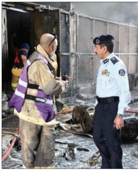
الفريق خالد المكراد يطلع على جهود الإطفائيين