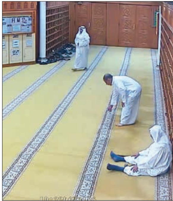
الارهابي في لوان مسجد الصادق