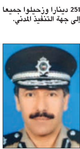
اللواء عابدين العابدين

توقيف مواطن من مواليد 1981 بعد ان تبين انه مدين بمبلغ 20,384 ديناراً، كما ضبط آخر من مواليد 1977 مطلوب مدني بمبلغ 21,100 دينار، ومواطنة من مواليد 1992 مطلوبة بمبلغ 615 ديناراً، وأخرى مطلوبة بمبلغ 2905 دنائير، ومواطن الوافدون فهم مصري ضبط بالنفرة ومطلوب بمبلغ 170 ديناراً فضلاً عن كونه لا يحمل إثباتاً، ونيبالي بمبلغ 110 دنائير وسريلانكي بمبلغ 161 ديناراً، وسوري بمبلغ