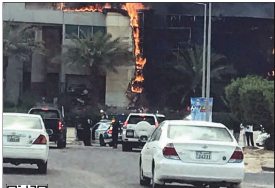
واجهة الجمعية احترقت بالكامل