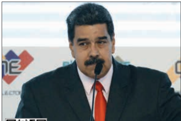
الرئيس الفنزويلي نيكولاس مادورو

جاء هذا القرار ردا من مادورو على مرسوم وقعه نظيره الأميركي دونالد ترامب منتصف الأسبوع، للحد من قدرة كراكاس على بيع أصولها. إلا أن واشنطن يمكن ألا تتكفي بذلك. فقد قال مسؤول في وزارة الخارجية الأميركية ان الولايات المتحدة يمكن أن تتخذ «تدابير مماثلة لمانحة» عندما «نفسلم التبليغ من الحكومة الفنزويلية عبر