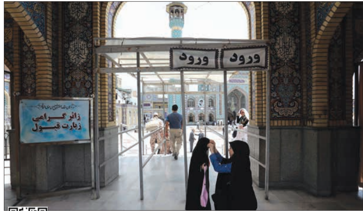
إيرانيون يزورون مسجد إمام زادة صالح في طهران

من جهتها، تواصل الدول الخمس الشريكة في الاتفاق النووي، رفضها القرار الأميركي بالانسحاب من الاتفاق والاستراتيجية