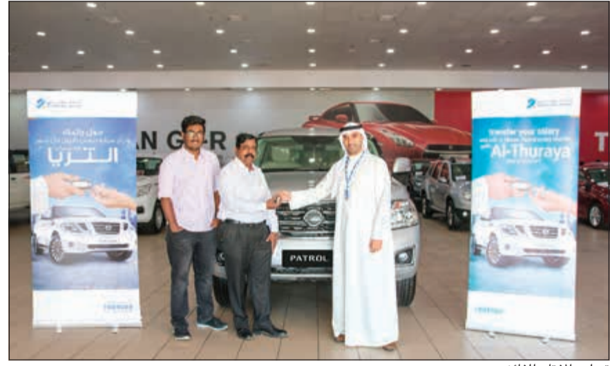
تسليم الفئاح للفائز

والوصول على المعلومات اللازمة، أو الاتصال بمركز خدمة العملاء أو زيارة الموقع الإلكتروني www.burgan.com .