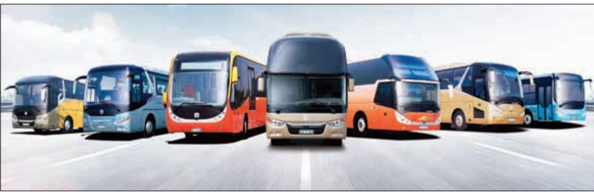
مجموعة حافلات «زونغتونغ».

و260 موديلها بينها حافلات هجينة وأخرى كهربائية. وتصنع زونغتونغ حافلات من سلسلة Sparkling المصممة لنقل الركاب والسياح إلى مسافة متوسطة وقصيرة.