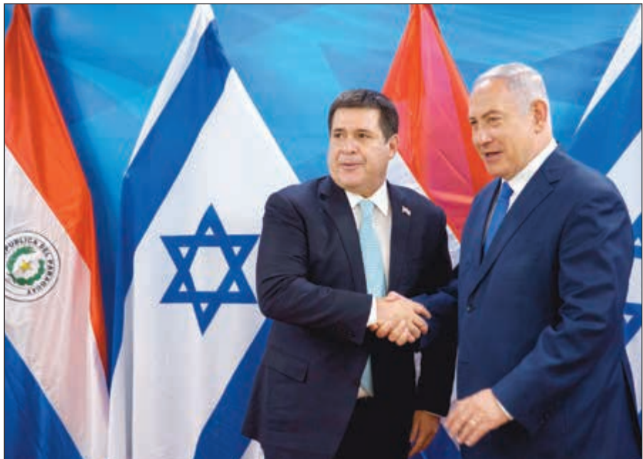
رئيس پاراگواي هوراشيو كارتيس يصادف رئيس الوزراء الإسرائيلي بنيامين نتنياهو في القدس امس (رويترز)

عواصم - وكالات: افتتحت پاراگواي سفارتها في القدس امس لتصبح ثالث دولة تقدي بالولايات المتحدة وتقل سفارتها في إسرائيل من تل أبيب بعد غواتيمالا. وحضر رئيس پاراگواي هوراشيو كارتيس ورئيس وزراء إسرائيل بنيامين نتنياهو مراسم الافتتاح. وألقى كل من كارتيس ونتنياهو كلمتين أثناء مراسم افتتاح السفارة في الحديقة التكنولوجية في الماحة بالقدس الغربية المحتلة. وعلقت لافتات بالغات الانجليزية والعبرية والعربية، وعلقت اعلام پاراگواي بالقرب من مداخل السفارة. ووصف كارتيس المعروف بصدافته لإسرائيل نقل سفارة بلاده إلى القدس بأنه «حدث تاريخي». قال نتنياهو ان التعاون بين