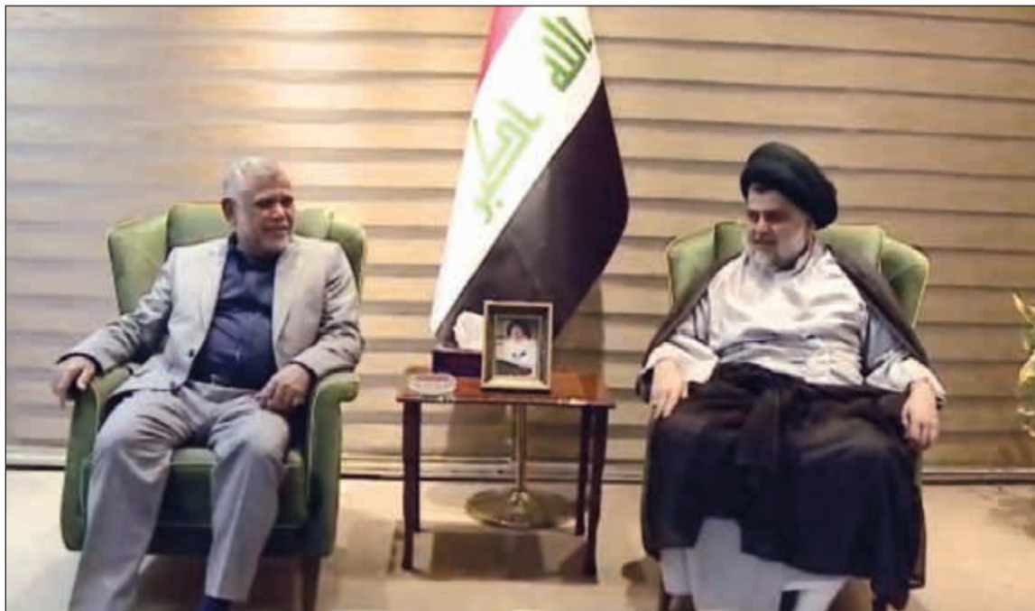
مقتدى الصدر مستقبلاً هادي العامري امس

عواصم - وكالات: التقى الصدر، الذي فازت كتلته «سائرون» بالانتخابات البرلمانية، بهادي العامري القيادي في الحشد الشعبي وزعيم كتلة «الفتح» الموالية لإيران والتي حلت في المرتبة الثانية، وسط معلومات عن توجه الكتل الأربع التي حلت في مقدمة نتائج الانتخابات، إلى تشكيل تحالف موسع. وأوضح الصدر للقاء في إطار مشاورات شاملة حول تشكيل الحكومة. وقال بيان لمكتب الصدر أمس الأول، إنه «أكد ضرورة الإسراع في تشكيل حكومة بأسرع وقت ممكن لتتمكن من تقديم الخدمات للشعب وتعبر عن تطلعاته المشروعة وضرورة أن يكون قرار تشكيل الحكومة قراراً وطنياً وأهمية مشاركة جميع الكتل الفائزة التي تنتهج مساراً وطنياً في تشكيل الحكومة المقبلة».