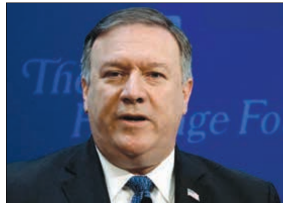
وزير الخارجية الاميركي مايك بومبيو يلقيا اول خطاب رسمي امس (رويترز)

مع مفوض الاتحاد الأوروبي لشؤون الطاقة ميغيل أرياس كانيثي، امس أنه يتعين على الاتحاد الأوروبي اتخاذ المزيد من الخطوات العملية «لزيادة استثماراته في إيران». وقال طريف إن دعم الاتحاد الأوروبي للاتفاق النووي، مشيراً إلى أن آلية التحقق وتفتيش المواقع النووية الإيرانية حالياً ليست كافية. ولغت إلى أن الاتفاق النووي مكن إيران من التوسع في حروبها بالوكالة في المنطقة، مشيراً إلى أنه كانت للاتفاق تبعات على كل من يعيش في الشرق الأوسط. وأشار إلى أن حزب الله بات أكثر قوة بسبب الدعم الإيراني المتزايد منذ توقيع الاتفاق النووي. وكان وزير الخارجية الإيراني محمد جواد ظريف أكد للاتحاد الأوروبي أن «دعمه السياسي، فقط ليس كافياً لإنقاذ الاتفاق النووي. تطوير منظومته النووية. ودعا الوزير الأميركي