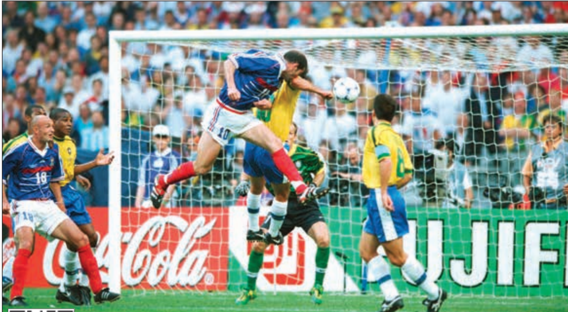
تلاعب تم في قرعة مونديال 1998 لتفادي مواجهة فرنسا والبرازيل إلا في النهائي

أقر الرئيس السابق للاتحاد الأوروبي لكرة القدم الفرنسي ميشال بلاتيني بوجود «حيلة» مغيبة في قرعة مونديال 1998 الذي استضافته بلاده وكان رئيس لجنته المظلمة، لتفادي لقاء البرازيل وفرنسا قبل المباراة النهائية. وأحزرت المنتخب الفرنسي بقيادة صانع ألعابه في حينها زين الدين زيدان، لقبه الوحيد في المونديال بفوزه على البرازيل في النهائي بنتيجة 3-0. وقال بلاتيني في حديث لإذاعة «راديو بلو سبور»: «نظمتنا البرنامج (القرعة) بطريقة أنه إذا أنهينا الدور الأول في صدارة مجموعتنا والبرازيل في صدارة مجموعتنا، لن يلقي المنتخبان قبل المباراة النهائية». ونشرت الإذاعة مقتطفات من الحوار مع المسؤول الأوروبي السابق، الموقوف لـ 4 أعوام على خلفية تلقيه دفعة مالية غير مشروعة بقيمة مليوني دولار من الرئيس السابق للاتحاد الدولي (فيفا) جوزيف بلاتر. وأقيم سحب قرعة المونديال