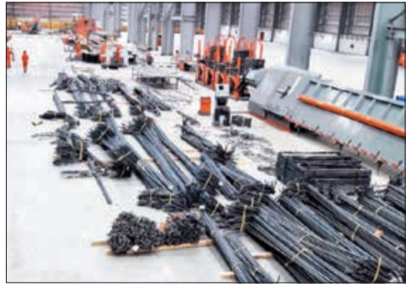
من داخل منشأة الكويت العالمية لخدمات الحديد