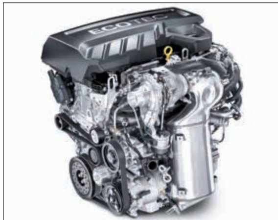
محرك التوربو سعة 2.0 لتر يرفع مستوى الأداء

الكفاءة وقوة الأداء. وفي تعليقه على هذين المحركين، قال أحمد سدودي، المدير الإقليمي لعلامة شفروليه الشرق الأوسط: «يتميز محركا التوربو المتوفران في طرازات اكويونكس 2018 الثلاثة لعملائنا بإمكانية اختيار المحرك الأكثر توافقاً مع متطلبات القيادة التي يفضلونها. ويقدم محرك التوربو سعة 1,5 لتر كفاءة غير مسبوقة، أما محرك التوربو سعة 2,0 لتر فهو مخصص للأداء الأقوى، ويجمع هذان المحركان بين قوة المحركات الكبيرة والاستهلاك الاقتصادي للوقود في المحركات الصغيرة.»