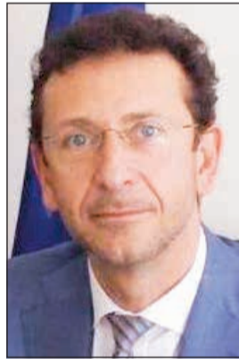
جيو سبيني سكوتاميليو

نفس التكنولوجيا التي سستلي احتياجات قطاع الإنشاءات المزدهر في سوق الكويت. وخلال زيارته للشركة، قام السفير الإيطالي بتهنئة المهندس كارلو ميكولي على تجهيز المنشأة بأفضل الآليات الإيطالية