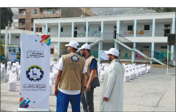
توزيع المواد التموينية