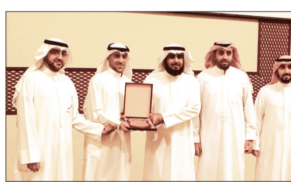
تكريم المعلمين الفائزين