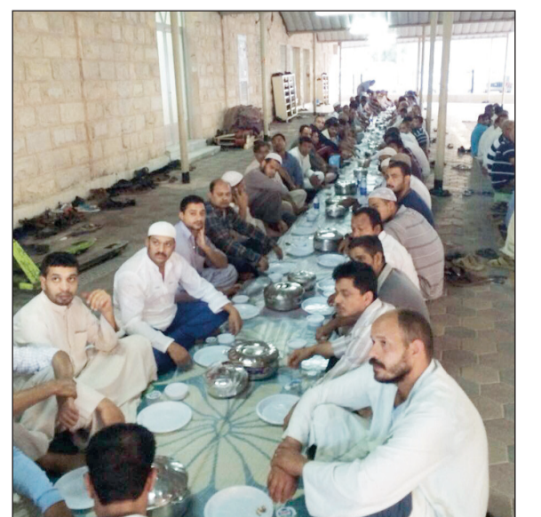
ولائم الإفطار من ثلث العثمان طوال الشهر الفضيل من موائد الإفطار