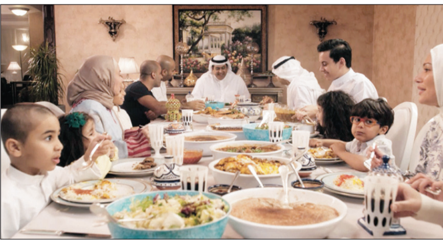
لقطة من الإعلان

المشاهد في رحلة تلقي الضوء على طبيعة أهل الكويت وتقديرهم لتجمع العائلة والأقارب والأصدقاء، عبر عدة لقطات معبرة بين الأهل في المنزل، والأماكن الأخرى. ويشكل إعلان «بيتك» الرمضاني هذا العام مشاهد مبتكرة بأفكار جذابة وإيجابية تعكس روح الضيافة والعطف والبهجة مزوجة بعبارات رمضان بما يتناغم مع قيم ومبادئ «بيتك»، كما تتفاعل كلمات الإعلان التلفزيوني مع الموضوعات المطروحة التي تعكس الروابط بروح الأسرة الواحدة بين أفراد المجتمع.