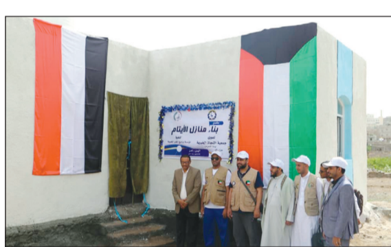
تشيد منازل الأيتام والفقراء

مع كامل مرفقاتها الخدمية، فالجمعية لديها أيتام من أهل اليمن وتحرص على التواصل معهم وتعليمهم وتقديرهم ورعايتهم، ليكونوا طاقات إيجابية فاعلة تعمل على نهضة وتطور اليمن، كما زار البندوس مبنى مركز صحي بمديرية الماسقط، ولمس خلال الزيارة الحاجة الشديدة للاهتمام من المنشآت الصحية اللازمة له وتوفير الأجهزة والمعدات الطبية والطواقم البشرية التي تشرف على المركز الصحي.