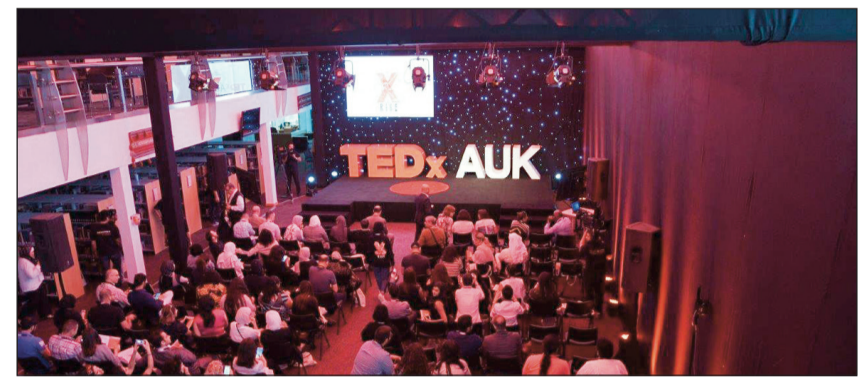
صورة عامة للمسرح