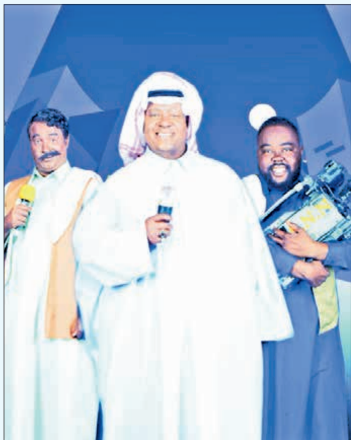
مسلسل «بات نايت»