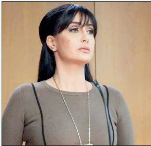
مسلسل «ضد مجهول»