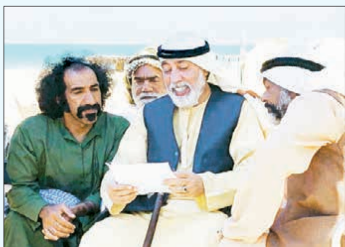
مسلسل «حدك مدك»