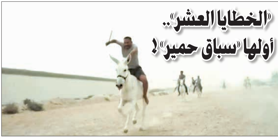
مشهد سباق الحمير في المسلسل

زاوية تسلط الضوء على أهم الأعمال الدرامية والبرامج المتنوعة المعروضة في شهر رمضان تنقدها أو تعلق عليها سواء بالإيجاب أو السلب.