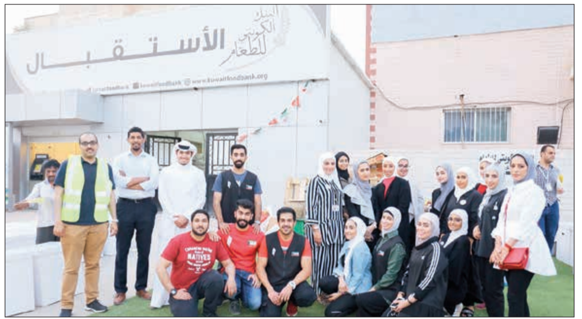
لقطة جماعية لأعضاء فريق مبادرة «الماجلة» من بنك الكويت الدولي (KIB)

في إطار مسؤوليته تجاه المجتمع وأفراده، أطلق بنك الكويت الدولي (KIB) مبادرة «الماجلة» الخيرية السنوية لتغطية احتياجات مجموعة من الأسر المتعففة في الكويت من المؤونة الغذائية خلال شهر رمضان المبارك. وتضمنت صناديق «الماجلة» مجموعة متنوعة من المواد الغذائية والأصناف التكميلية الأساسية التي تحتاجها الأسر خلال الشهر الكريم، حيث تم توزيعها على أكبر عدد ممكن من المستفيدين والعائلات المحتاجة خلال شهر الخير والعطاء. وبهذه المناسبة، قال مدير