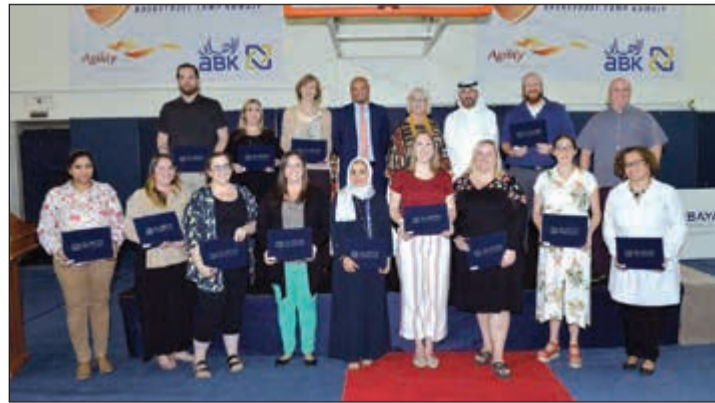
عدد من المكرمين في لقطة جماعية