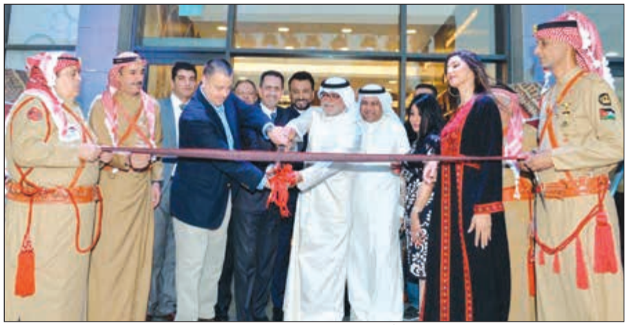
النائب صلاح خورشيد والسفير الأردني صفير أبوشتال وم. محمود رشيد والحضور لدى قص شريط الافتتاح