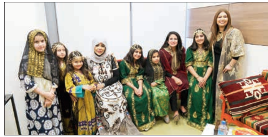
لقطة مع الأطفال

أواصر الترابط وأجواء الأسرة الواحدة بين موظفيها من مختلف الأقسام. كما تستعد الشركة لإطلاق برنامجها الرمضاني الحافل بالمبادرات الخيرية، والتي تشمل توزيع وجبات الإفطار على المحتاجين سواء من خلال خيمة إفطار الصائم أمام مبنى الشركة الرئيسي أو على مختلف المناطق التي تكثر فيها مساكن العمالة والأسر المتعففة. وتفتخر الشركة بأن مبادراتها الخيرية على مدار الشهر الفضيل تدار بالكامل من قبل شباب وشابات برنامجها التطوعي «نعين ونعاون» الذي تطلقه الشركة للعام الرابع على التوالي، إيماناً منها بأهمية احتضان الطاقات الشبابية ومساعدتهم على تحقيق طموحاتهم، والذي نجح باستقطاب أكثر من 300 مشارك هذا العام.