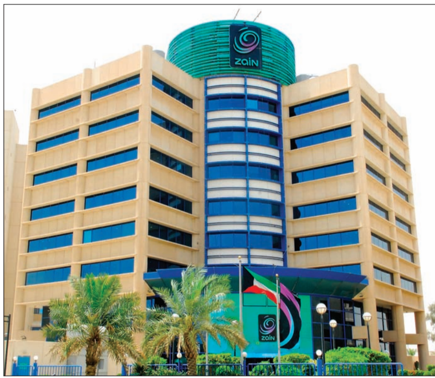
المقر الرئيسي لشركة «زين»

وحول السودان ومدى توقع انخفاض جديد للعملة قال متي إن المعدل الذي نستخدمه هو أساساً يمثل سعر البنك المركزي السوداني الذي يبلغ حوالي 30 جنديها مقابل الدولار، وأسعار السوق السوداء تعتمد على العرض والطلب، ولكننا نعتقد أن