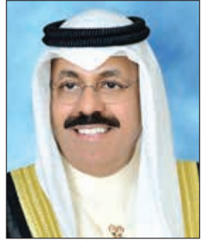
الفريق أول م. الشيخ أحمد النواف

الجليلة وتمنياته بان يعيدها الله على الكويت الأوفياء والعزّة والرخاء والأمن والأمان وعلى الأمتين العربية والإسلامية بالخير واليمن والبركات، مبهتلا إلى المولى عز وجل أن ينعم على صاحب السمو الأمير وسمو ولي عهده الأمين بدوام الصحة والعافية وطول العمر.