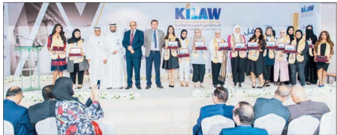
مجموعة من الطالبات الفائقات في لحظة تذكارية

المشاركة في مسابقات محلية وإقليمية وعالمية لما في هذه المسابقات من فوائد يجنيها طالب القانون. وأضاف د. العتيبي: من خلال متابعتي أعرف أن العديد من هؤلاء المكرمين عملوا ويعملون على بلورة شخصياتهم من خلال تحقيق