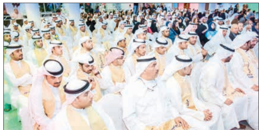
عدد من الطلاب الفائقين

في مسابقات محلية وإقليمية وعالمية لما في هذه المسابقات من فوائد يجنيها طالب القانون. وأضاف د. العتيبي: من خلال متابعتي أعرف أن العديد من هؤلاء المكرمين عملوا ويعملون على بلورة شخصياتهم من خلال تحقيق