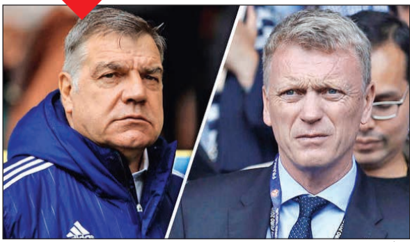
ديفيد مويس وسام الأردايس

قرر إيفرتون أمس التخلي عن خدمات مدربه سام الأردايس، رغم نجاحه في تجنب الفريق الهبوط إلى الدرجة الأولى وإنهاء الدوري الإنجليزي الممتاز لكرة القدم في وسط الترتيب. وقال القطب الثاني في مدينة ليفربول في بيان على موقعه الرسمي «بإمكان نادي إيفرتون لكرة القدم التأكيد أن سام الأردايس ترك منصبه كمدرّب».