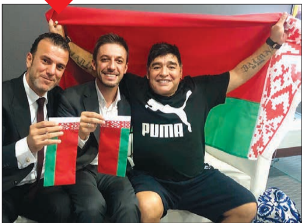
الأسطورة الأرجنتينية دييغو مارادونا مع فريقه الجديد

سيتولى دييغو مارادونا أسطورة كرة القدم الأرجنتينية رئاسة دينامو بريست المئتمني لدوري روسيا البيضاء لكرة القدم بعقد ثلاث سنوات.