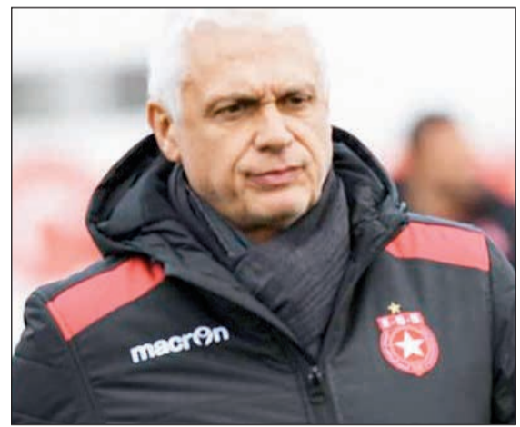
الفرنسي فيلود يعود إلى البلاد 27 الجاري لقيادة فريق الكويت

كانت سبباً مباشراً لتحقيق الانتصارات المتتالية. من جانب آخر، ارتفع عدد السير الذاتية للاعبين المحترفين المعروض على طاولات الجهاز الإداري والفني للفريق الأول لكرة القدم حتى أمس إلى 12 لاعباً متنوعاً من الجنسية الأفريقية والبرازيلية والأسبوية ومن المقرر أن يفاضل الجهاز الفني للفريق بقيادة الفرنسي هوبير فيلود بالتعاون مع الجهاز الإداري بين السير المختلفة لاختيار العناصر الأجدر بتمثيل الفريق للمرحلة المقبلة والتي تشهد مواجهة الاسماعيلي المصري 11 أغسطس المقبل ضمن الدور الـ 32 من البطولة العربية للأندية. وكانت إدارة النادي