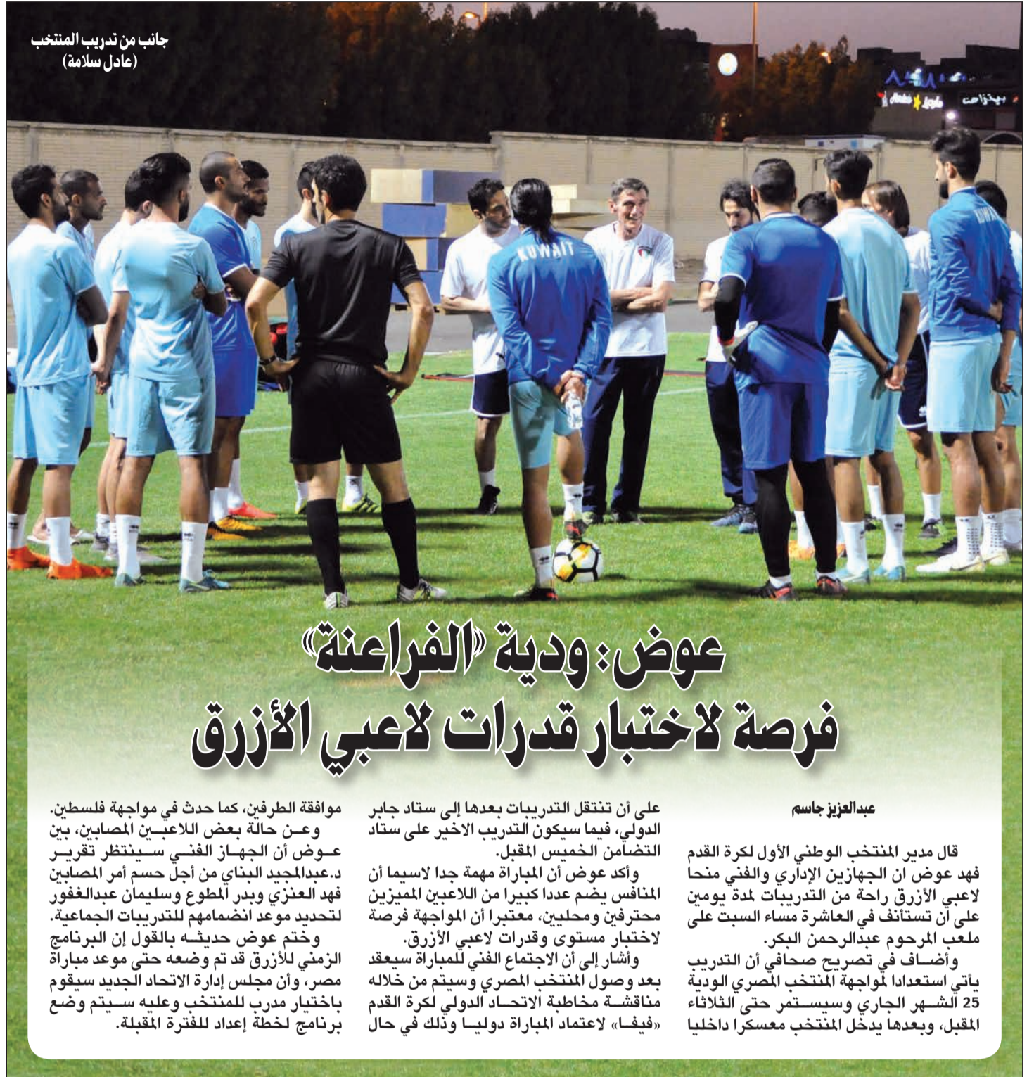
جانب من تدريب المنتخب