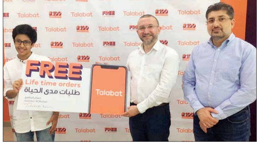
طلبات مدى الحياة... من «طلبات»