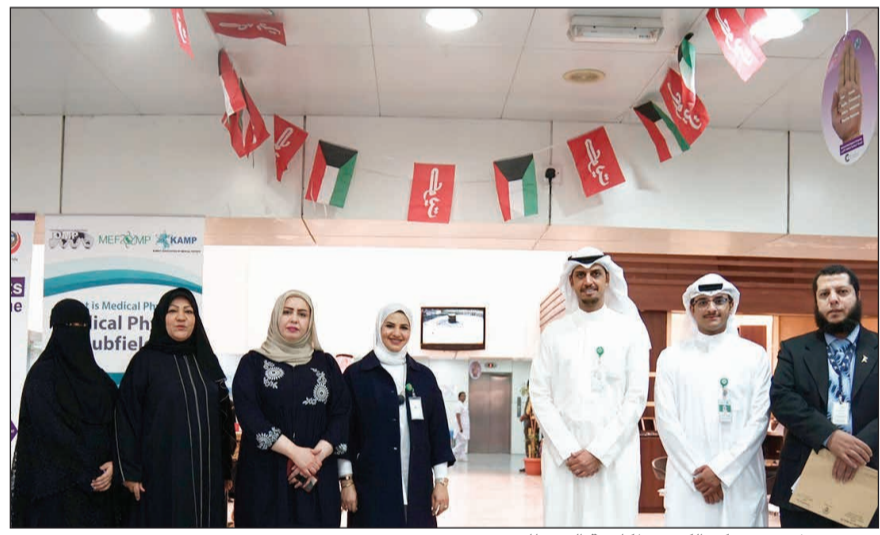
فريق «بيتك» في مركز الكويت لمكافحة السرطان

ضمن إطار برنامج الحافل في شهر رمضان المبارك «تواصل بالخير في شهر الخير 4»، واستمرارا لريادته في المسؤولية الاجتماعية، نظم بيت التمويل الكويتي «بيتك» زيارة لنزلاء مركز الكويت لمكافحة السرطان، إيماناً بأهمية عيادة المرضى وتعزيزاً لقيم التواصل مع كل فئات المجتمع. وهذا فريق «بيتك» نزلاء المركز بمناسبة حلول شهر رمضان المبارك مساهمة بإدخال البهجة والسرور عليهم وتخفيف آلامهم في جو أسري تملأه الأخوة والمحبة، مما كان له الأثر الطيب عليهم في هذه الأيام المباركة، حيث قدم الفريق «بيتك» هدايا رمضانية للمرضى مع التحنن بالشفاء والصحة والعافية للجميع. ويحرص «بيتك» سنويا في شهر رمضان على تنظيم فعاليات وزيارات تهدف إلى تعزيز أواصر الصلة مع المجتمع ونشر البهجة والسرور بين أبنائه. ويشمل برنامج «بيتك» في رمضان أنشطة ومساهمات إنسانية واجتماعية متعددة، ومبادرات توعوية وتواصل يومي مع الجمهور، تأكيداً على حرص البنك على الالتزام برسائله الاجتماعية والإنسانية بما يرسخ مفهوم المسؤولية الاجتماعية، ويهدف إلى دعم كل مبادرات العمل التطوعي والإنساني، انسجاماً مع القيم الاجتماعية وتعزيزاً لأهداف التنمية المستدامة.