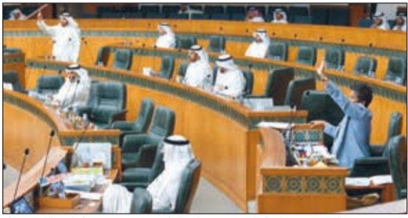
جانب من مشاركة بين صفاء الهاشم وحمدان العازمي

2019/2018. كما أقر المجلس الحساب الختامي لهيئة الطرق بالإضافة إلى الميزانية الخاصة بها. وخلال الجلسة طالب النواب بضرورة تعديل اللائحة في شأن مناقشة الإسئلة البرلمانية والررد عليها ومعالجة حساب العهد وتحصيل مستحقات الحكومة البالغة 2 مليار و200 مليون دينار مع إلغاء هيئة الطرق بسبب عدم فاعليتها. ورفض النواب مجددا الحديث عن تطبيق الضرائب على المواطنين أو ما يسمى بالقيمة المضافة، منتقدين ضعف الحكومة في تنفيذ المشاريع التنموية.