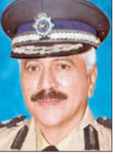
الفريق محمود الدوسري

أبرزتي شددت وزارة الداخلية، في تعميم موقع من وكيلها الفريق محمود الدوسري، على جميع الأجهزة ضرورة التنسيق مع قطاع الشؤون المالية لاتخاذ جميع الإجراءات المتبعة للحد من الإنفاق في المصروفات غير الضرورية وفي أضيق الحدود لكن بما لا يؤثر على متطلبات العمل الأمني وتادية مهامه للحفاظ على أمن الوطن والمواطنين. وأكد التعميم على كل الإدارات اتخاذ الخطوات والإجراءات اللازمة لتنفيذ ضوابط المصروفات والترشيد الجاد للإنفاق العام، وترتيب الأولويات للاحتياجات الضرورية في ضوء الاعتمادات المتاحة، بما لا يؤثر على متطلبات العمل الأمني وتادية مهامه واتخاذ كل الإجراءات المطلوبة لترشيد الإنفاق. وحدد التعميم 8 إجراءات للترشيد أهمها: تقنين الدورات التدريبية واعتماد الدورات الداخلية بدلا من الخارجية، التي جانب تقليص عدد المهمات الرسمية الخارجية إلا في أضيق الحدود، والترشيد في أعمال الصيانة والترميم وكل المتطلبات السلعية والخدمية مع التقليل من طلب استئجار السيارات. وأوصى التعميم بتقنين المشاركة في المؤتمرات والدورات التي تعقد خارج البلاد إلا في أضيق الحدود، وكذلك جعل اجتماعات اللجان الدائمة والمؤقتة وفرق العمل في أوقات الدوام الرسمي إلا في الضرورة القصوى، وأيضا تمكين ديوان المحاسبية والمراقبين الماليين وشؤون التوظيف من ممارسة اختصاصاتهم والتعاون معهم للعمل على تلافي جميع الملاحظات والمخالفات الواردة في تقارير الجهات الرقابية. وشدد التعميم على التقنين في طلب الأعمال الإضافية وحجز القوة إلا في حالة الضرورة القصوى.