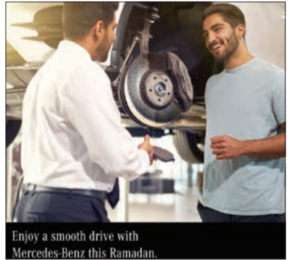
Enjoy a smooth drive with Mercedes-Benz this Ramadan.