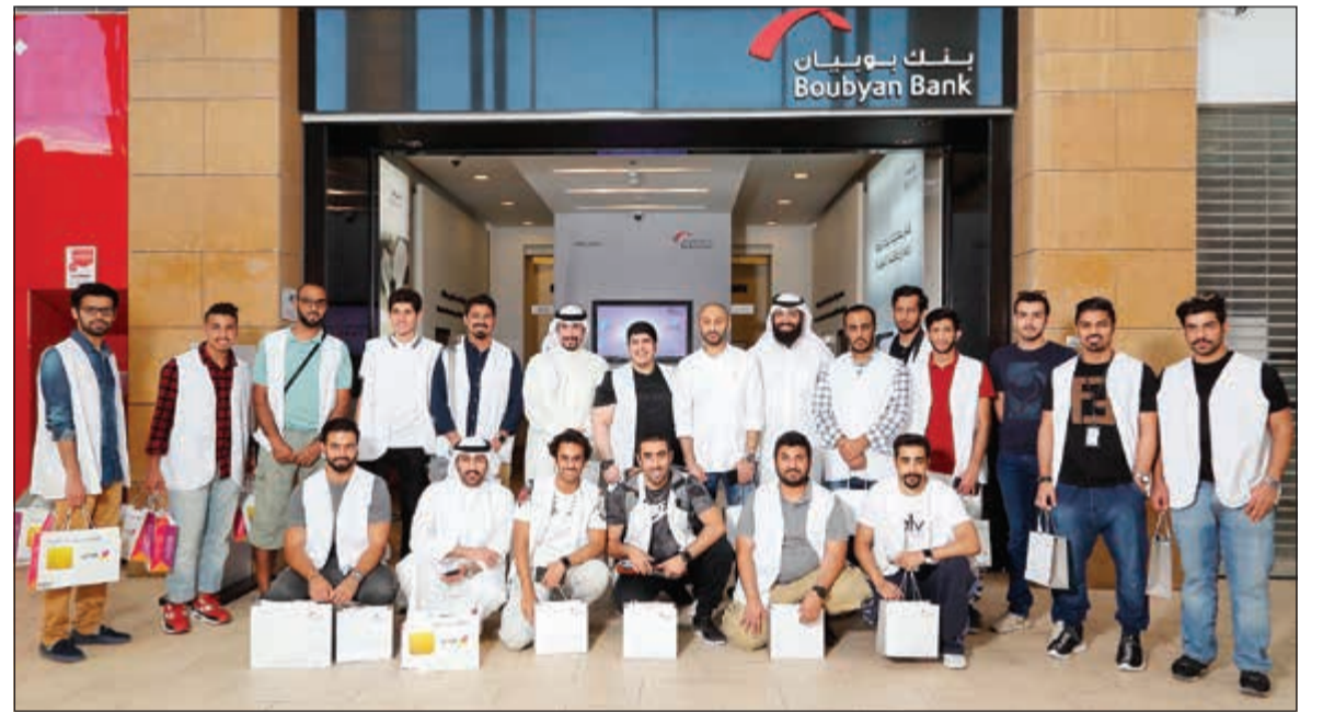
صورة جماعية للمشاركين