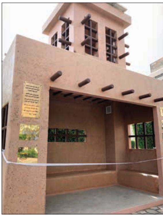
المحطة المستدامة لانتظار الحافلات

الصباح حفظه الله ورعاه بان تعمل الكويت بالطاقة البديلة بنسبة 15٪ بحلول العام 2030. وبين الخشتي: نحن نحرص على أن تقوم جهودنا بالمساهمة بشكل فعال في تقديم قيمة مضافة للمجتمع، مع الحرص على الحفاظ على بيئة كويتنا الحبيبة في نفس الوقت، فالمحطة التي نذشنها اليوم تتميز باستخدام الواح الطاقة الشمسية بالكامل للترزود بالكهرباء، وذلك لتشغيل أجهزة التبريد والتهوئة، بالإضافة إلى تشغيل إنترنت الـ WiFi ليستخدم منها مستخدمو المحطة، لتكون بذلك قد قدمنا خدمة مجتمعية وفق معايير بيئية عالمية.