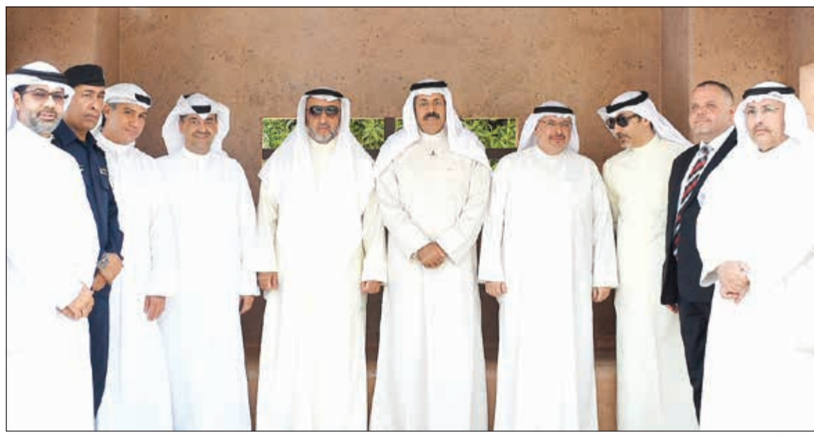
الشيخ أحمد النواف متوسلاً الخشتي والحسان والمهنا خلال حفل التدشين

أعلن البنك الأهلي المتحد عن مواعيد العمل في فروعها خلال شهر رمضان الفضيل، حيث ستقوم البنوك باستقبال عملائه الكرام خلال فترة عمل واحدة من الأحد إلى الخميس ابتداء من الساعة العاشرة صباحاً حتى الساعة الواحدة والنصف بعد الظهر. وأكد البنك في بيان صحافي استعداده جميع فروعها الـ 38 المنتشرة في جميع مناطق الكويت لاستقبال العملاء خلال الشهر الفضيل وتقديم كل الخدمات المصرفية لهم عبر جميع أجهزة السحب الآلي التي جانباً تامين الخدمات المصرفية الإلكترونية عبر الإنترنت والموبايل. كما وضع البنك في تصرف عملائه خدمة حياكم الهاتفية على 1812000 للإجابة عن استفساراتهم، ويمكن للعملاء زيارة موقع البنك الإلكتروني www.ahliunited.com.kw . وبمناسبة حلول شهر رمضان الفضيل، يتقدم البنك الأهلي المتحد بخالص التهنية وأطيب التمنيات لصاحب السمو الأمير الشيخ صباح الأحمد، وسمو ولي العهد الشيخ نواف الأحمد، كما يتقدم بخالص التهنية وأطيب الأمنيات لحكومة وشعب الكويت، وجميع المقيمين بها.