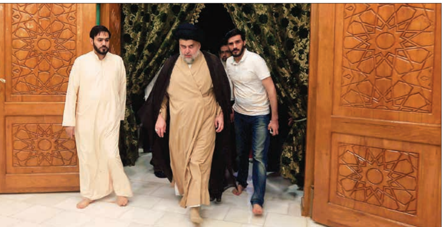
رجل الدين الشيعي العراقي مقتدى الصدر يزور قبر أبيه بعد إعلان نتائج الانتخابات الجزئية في النجف أمس

مقعدا. ونحن في المركز الأول على مستوى العراق من حيث النتائج، وبالطبع، إذا عززت النتائج النهائية الرسمية وضعنا الراهن سيكون من حق تحالفنا التمسك بالمطالبة بمنصب رئاسة الحكومة، ونعزّم ترشيح أكثر من شخصية لهذا المنصب». ويحسب وثيقة متداولة اعلاميا بالعراق تظهر فوز كتلة الصدر بالتصويت الشعبي على مستوى البلاد بحصولها على أكثر من 1,3 مليون صوت و54 من مقاعد البرلمان وعددها 329 مقعدا. وأظهرت حسابات «رويتزن» بناء على الوثيقة أن العامري في المركز الثاني بحصوله على أكثر من 1,2 مليون صوت أي 47 مقعدا في البرلمان. ثم العامري الذي حصل على أكثر من مليون صوت و42 مقعدا. وجاء رئيس الوزراء السابق نوري المالكي وهو حليف وثيق لإيران مثل العامري في المركز الرابع بحصوله على 25 مقعدا.