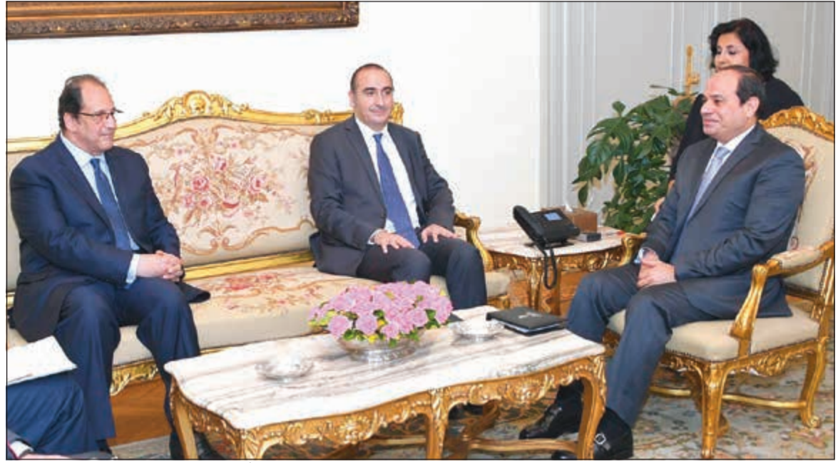
الرئيس المصري عبدالفتاح السيسي خلال لقائه مع رئيس جهاز الاستخبارات الداخلية الفرنسي لوران نونيز بحضور القائم بأعمال رئيس المخابرات العامة اللواء عباس كامل