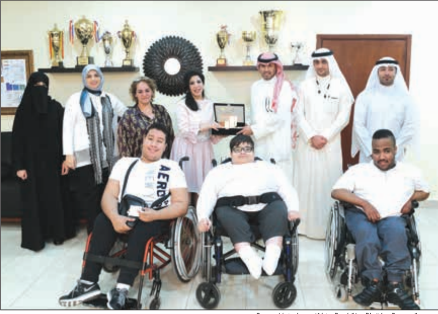
درع تكريمية ولقطة تذكارية خلال زيارة المدرسة

في إطار سعيه الدائم لمشاركة الطلبة والطالبات فرحة التخرج والتفوق بعد إتمام عام دراسي مليء بالتحديات، وتأكيداً لدوره الرائد في دعم كل الفعاليات التربوية التي تعنى بخدمة العملية التعليمية بشكل كلي، قام البنك التجاري برعاية حفل تفوق وتخرج طلاب مدرسة الرجاء - بنين، التابعة لإدارة مدارس التربية الخاصة.