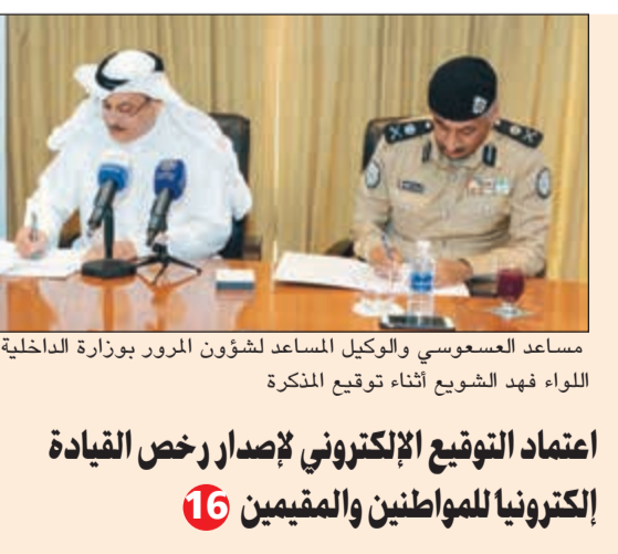
مساعد السعوسي والوكيل المساعد لشؤون المرور بوزارة الداخلية اللواء فهد الشويح أثناء توقيع المنكرة

طعن بالنتائج. وحل في المركز الاول تحالف «سائرون» بقيادة مقتدى الصدر الذي أعلن تمسكه برئاسة الحكومة، بينما احتل المركز الثاني تحالف «الفتح» الذي يضم فصائل الحشد الشعبي بقيادة هادي العامري، وتراجع رئيس الوزراء حيدر العبادي في المركز الثالث رغم أنه خاض الانتخابات باعتباره المرشح الأوفر حظاً. التفاصيل 35