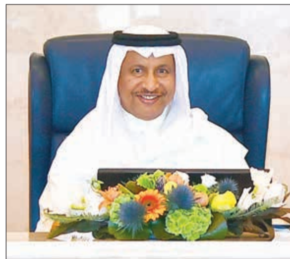
سمو رئيس مجلس الوزراء الشيخ جابر المبارك خلال جلسة أمس

تحدثت مصادر نيابية عن التوصل إلى صيغة توافقية بين الحكومة واللجنة المالية البرلمانية حول تعديلات قانون التقاعد المبكر تضمن ترمير المداولة الثانية في جلسة مجلس الأمة اليوم. وتودر الصيغة التوافقية حول إضافة خصم 1% إلى نسبة الخصم الحالية البالغة 5%. فبينما ترى الحكومة أن نسبة الخصم الحالية البالغة 5% إضافة نسبة خصم 1% على جميع الموظفين تمكنها من تنفيذ القانون الذي يكلف الميزانية 60 مليوناً سنوياً، تساءلت المصادر النيابية: كيف تفرض نسبة الـ 1% على موظفين لا يرغبون التقاعد المبكر وتالياً لن يكلف الصناديق الاكتوارية شيئاً؟ وتضيف: من الظلم فرض النسبة على جميع الموظفين