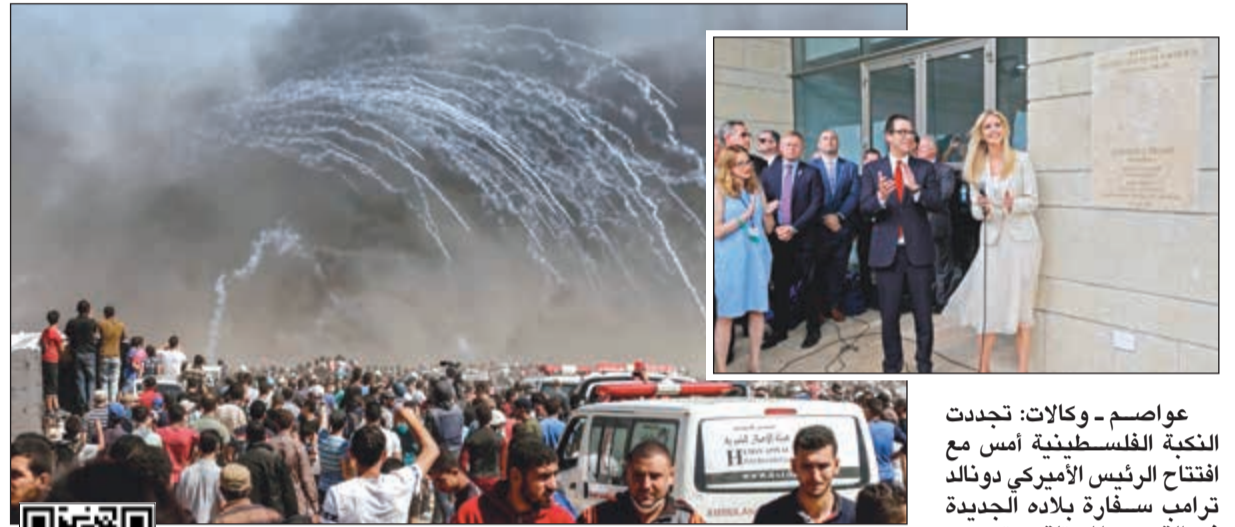
مئات الفلسطينيين تظاهروا في جميع الأراضي المحتلة لرفض القرار الأميركي وفي الإطار جانب من حفل افتتاح السفارة الأميركية بالقدس المحتلة

'التمدين' تبشر الأعمال الإنشائية للمرحلة الأولى من مشروع 'الخيران' في قلب مدينة صباح الأحمد البحرية 28