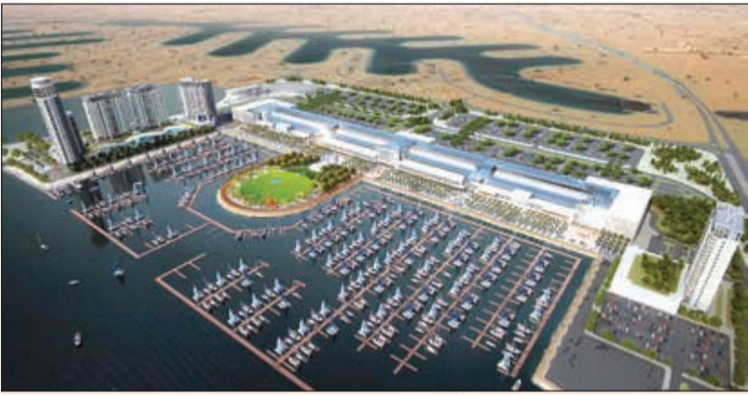
مشروع 'الخيران'، نبض الكويت الجديد أكبر واجهة بحرية ينفذها القطاع الخاص في الكويت

'التمدين' تبشر الأعمال الإنشائية للمرحلة الأولى من مشروع 'الخيران' في قلب مدينة صباح الأحمد البحرية 28