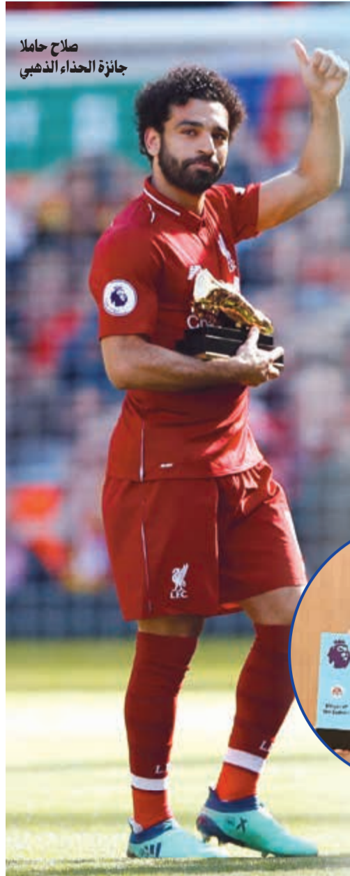
صلاح حاملا جائزة الحذاء الذهبي

حصد النجم المصري لنادي ليفربول محمد صلاح الأحد جائزة إضافية في موسمه الأول الاستثنائي مع ناديه، باختياره لاعب العام من قبل رابطة الدوري الإنجليزي الممتاز لكرة القدم، وهي رابع جائزة أفضل لاعب ينالها خلال أسابيع. وسبق لصلاح (25 عاما) أن اختير أفضل لاعب هذا الموسم من قبل رابطة اللاعبين المحترفين، ومن قبل جمعية صحافيي كرة القدم الإنجليزي، إضافة إلى اختياره أفضل لاعب من قبل ناديه ليفربول الذي تعاقده معه صيف العام الماضي قادما من روما الإيطالي.