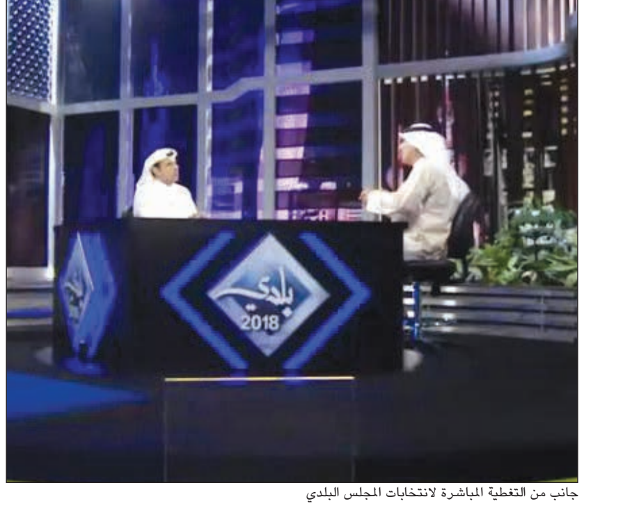
جانب من التغطية المباشرة لانتخابات المجلس البلدي