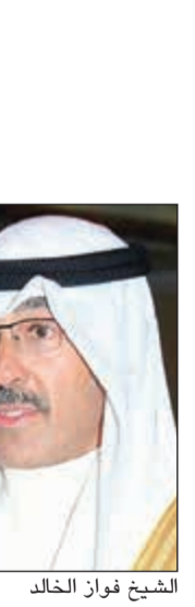
الشيخ فوز الخالد

بالشكر والتقدير لوزارات ومؤسسات الدولة الرسمية في محافظة الأحمدى خاصة والكويت عامة، على جهودها المشهودة في الإعداد والتنفيذ لخدمة عمل الموكلتة اليهم، متطلعا إلى عطائهم المشهود، وساهمهم في مرحلة الكويت الجديدة 2035 التي يمثل العمل البلدي إحدى أهم ركائزها. وأشار الخالد إلى أن الانتخابات التي جرت في أجواء متميزة أيضا تضيف رصدا جديدا إلى مسيرة الديموقراطية الكويتية التي تعد نموذجا يحتذى في المنطقة، متوجهاً