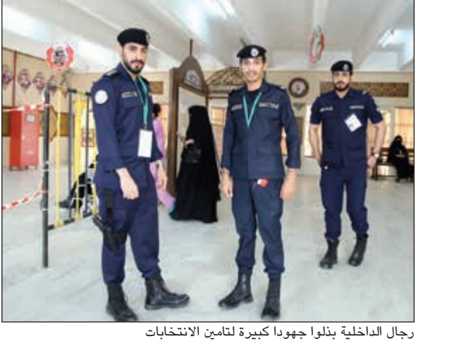
رجال الداخلية بذلوا جهودا كبيرة لتأمين الانتخابات