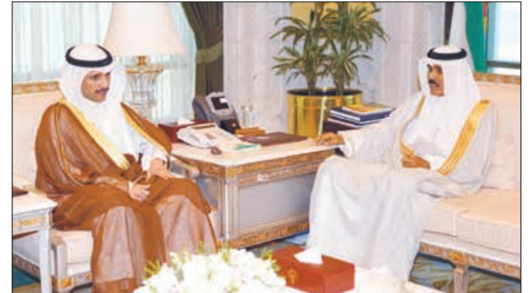
سمو نائب الأمير وولي العهد الشيخ نواف الأحمد مستقبلا رئيس مجلس الأمة مرزوق الغانم