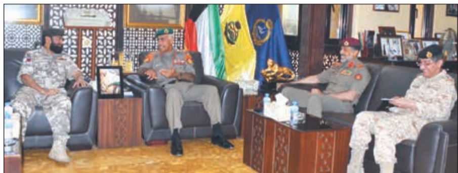
الدقيق محمد الخضر خلال استقباله قائد قوات الدفاع الجوي القطري اللواء ركن طيار حمد التابت

بحث رئيس الأركان العامة للجيش الفريق الركن محمد الخضر أمس مع قائد قوات الدفاع الجوي القطري اللواء ركن طيار حمد التابت أهم الأمور والمواضيع العسكرية ذات الاهتمام المشترك.