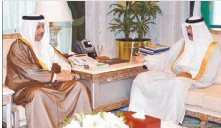
سمو نائب الأمير وولي العهد الشيخ نواف الأحمد مستقبلا سمو الشيخ جابر المبارك