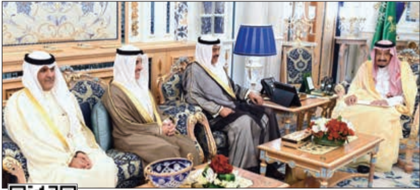
مبعوث صاحب السمو الأمير يسلم رسالة خطية من سموه إلى خادم الحرمين الشريفين الملك سلمان بن عبدالعزيز آل سعود

شارك ممثل صاحب السمو الأمير الشيخ صباح الأحمد، حفظه الله ورعاه، سفيرنا لدى جمهورية السنغال والمحالي جمهورية سيراليون صالح الصقعي في مراسم تنصيب جوليوس مادا بيو رئيسا جديدا لجمهورية سيراليون بعد فوزه في الانتخابات الرئاسية الأخيرة. وذكرت سفارة الكويت لدى جمهورية السنغال في بيان أمس أن عددا من رؤساء الدول الأفريقية وممثلي الحكومات وأعضاء السلك الدبلوماسي وكبار المدعوين شاركوا في حفل التنصيب. ووفقا للبيان، نقل السفير الصقعي تحيات صاحب السمو الأمير إلى القيادة الجديدة وشعب سيراليون الصديق، متمنيا لهم التوفيق في مسيرتهم الجديدة نحو البناء والتقدم والازدهار.