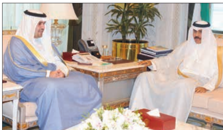
سمو نائب الأمير وولي العهد الشيخ نواف الأحمد مستقبلا نائب رئيس الوزراء ووزير المالية أنس الصالح