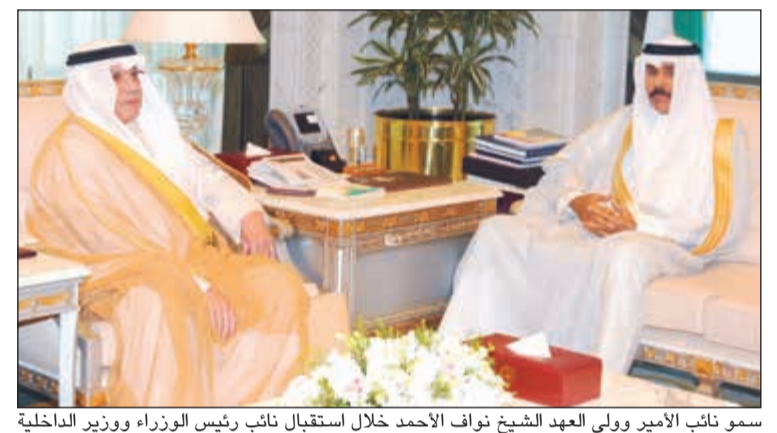
سمو نائب الأمير وولي العهد الشيخ نواف الأحمد خلال استقبال نائب رئيس الوزراء ووزير الداخلية الشيخ خالد الجراح