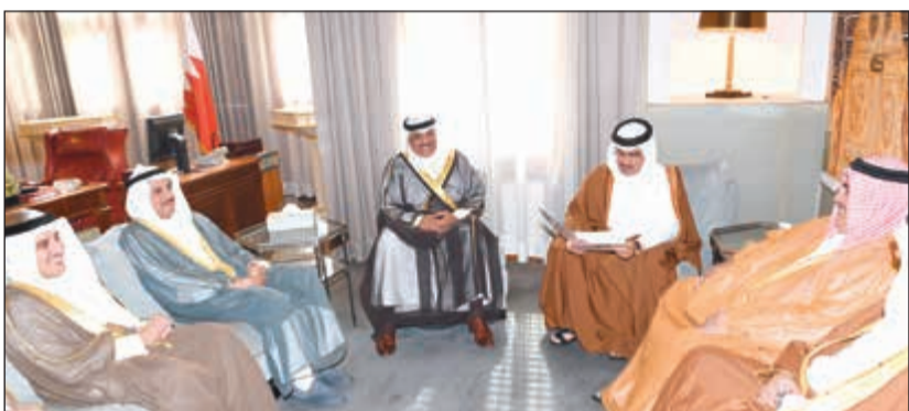
مبعوث صاحب السمو يسلم رسالة خطية من سموه لملك البحرين تسلمها صاحب السمو الملكي الأمير سلمان بن حمد آل خليفة

كما قام مبعوث صاحب السمو الأمير الشيخ صباح الأحمد، نائب رئيس مجلس الوزراء ووزير الخارجية الشيخ صباح الخالد، عصر أمس بتسليم رسالة خطية من صاحب السمو إلى أخيه صاحب الجلالة الملك حمد بن عيسى بن سلمان آل خليفة ملك مملكة البحرين الشقيقة تضمنت آخر المستجدات على الساحتين الإقليمية والدولية والقضايا ذات الاهتمام المشترك.