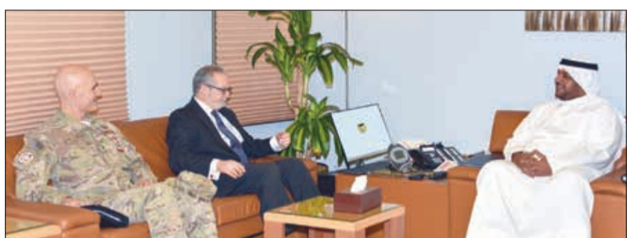
الشيخ أحمد المنصور خلال استقباله السفير الأميركي لورنس سيلفرمان وعميد الركن طيار سانت كلمنتي الأميركي.

بحث وكيل وزارة الدفاع الشيخ أحمد المنصور أمس مع سفير الولايات المتحدة الأميركية لدى البلاد لورنس سيلفرمان سبل تعزيز التعاون العسكري بين البلدين.