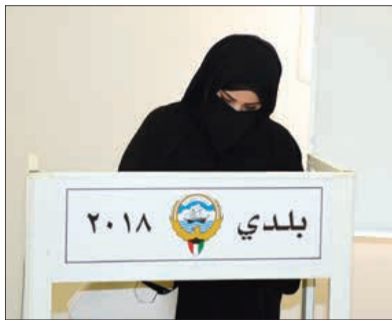
ناخبة تنلي بصوتها