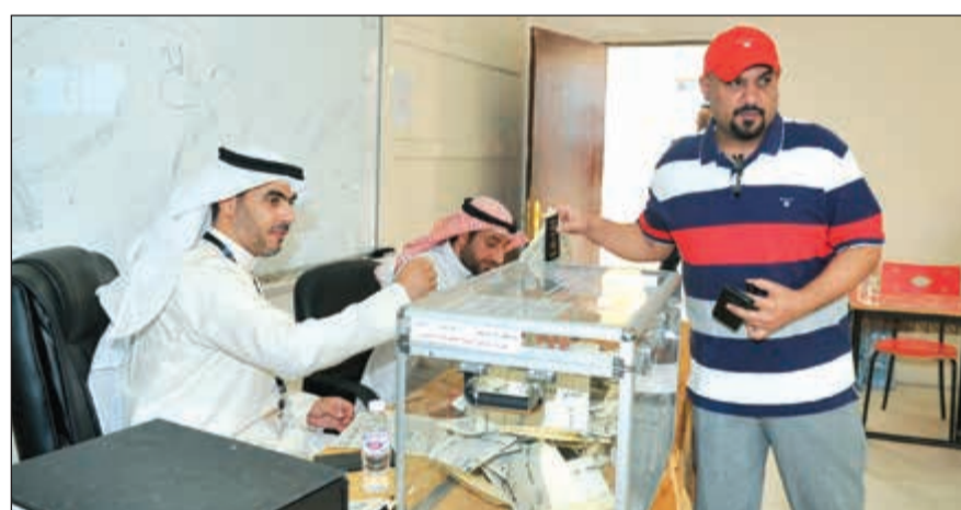
أحد ناخبي الدائرة السابعة يدلي بصوته