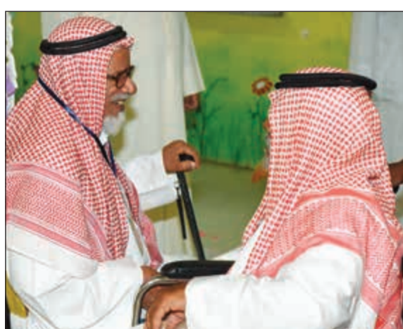
حديث بين ناخبين من كبار السن