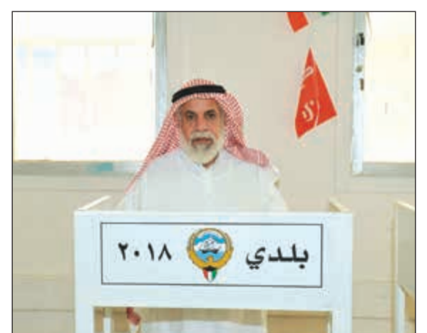
أحد كبار السن يختار مظهره