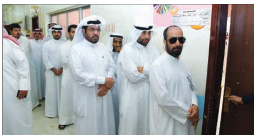
جانبا من الناخبين أمام إحدى لجان الدائرة الثامنة