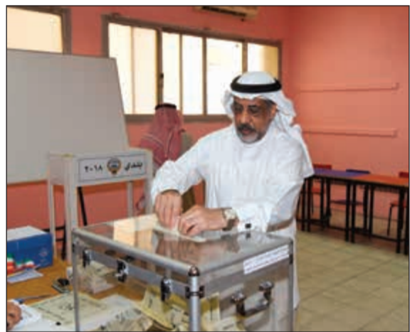
..وناخب يختار مرشحه