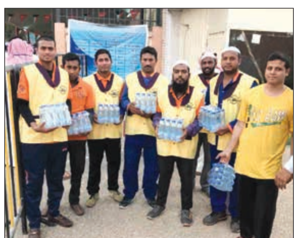
جمعية التعميم توزع المشروبات أمام المقار الانتخابية