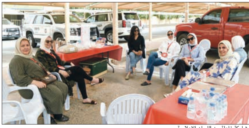
مشاركة فاعلة من اللجان الاعلامية