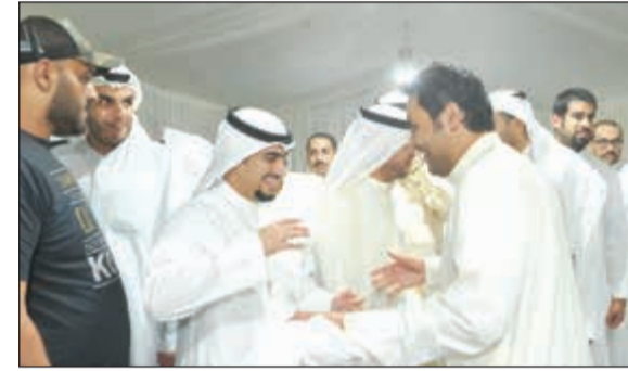
جانبا من فرحة الفوز

كما طالب العديلية الحكومة بتمكين المجلس البلدي من دوره وعدم سلب اختصاصاته وذلك وفق القانون وعلى الوزير الأخذ بآراء واقتراحات أعضاء المجلس البلدي لتحقيق المصلحة العامة.