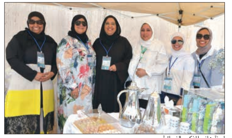
لجنة هاني الذكور النسائية