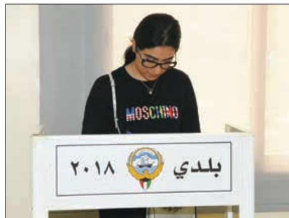
ناخبة تدي بصوتها