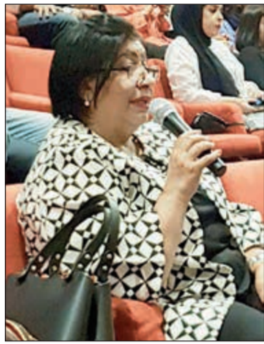
الإعلامية أمل عبدالله