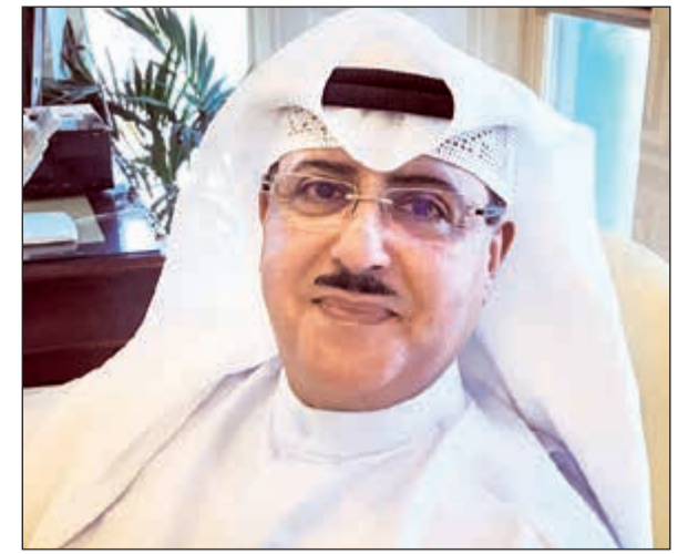
الشيخ فهد المبارك