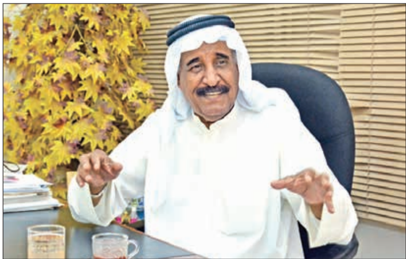
الفنان القدير محمد جابر

لأنها خط درامي جديد.. مسلسل «مع حصة قلم» دراما اجتماعية تناقش قضية النسب وتاريخها على الشخص المصاب والمحيطين به، والعمل إنتاج «المجموعة الفنية» للفنان باسم عبدالأمير، تأليف الكاتب علي دوحان، إخراج مناف عبدال، وبطولة: حياة الفهد، محمد جابر، زهرة الخرجي، باسم عبدالأمير، يعقوب عبدالله، مشاري البلا، حسين المهدي، عبير أحمد، نور الغندور، فوز الشطي، عبدالله الطليحي، إلهام علي، ياسة، راج العلي، شهد الكندري ونواف النجم. من جهة أخرى، كشف محمد جابر عن مشاركته في مسرحية بعيد الفطر المقبل، سيتم عرضها بالأحساء في السعودية وتحمل عنوان «العشة»، وقال إنها كوميدية ساخرة وتناقش مواضيع متعددة تهم الناس، بمشاركة كوكبة من نجوم المملكة.