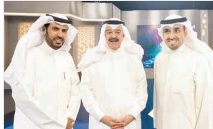
يوسف الجاسم ضيف إحدى حلقات البرنامج متوسطا العصيمي والعجمي

مختلف المجالات ويقابل شائق ويسبر غور تلك الشخصيات البارزة، منتقلاً إلى مسيرته الثرية، حيث يقوم بتفحصها بشك دقيق، وينقل وجهة نظرها حول الكثير من القضايا والأمور المحيطة اجتماعياً وكورياً وثقافياً وسياسياً وإنسانياً، إضافة إلى التطرق إلى جوانب خارج مجالها ومحيطها. وأشار العجمي إلى أن البرنامج يحتوي على فقرات متنوعة تعتمد على استديو ضخم جداً، وفي طريقة ورؤية إخراجية مختلفة تعتمد على الكرين والكاميرات المتعددة، لافتاً إلى أنه يحمل طريقة مختلفة عن مسار برامج غالب العصيمي السابقة، وإضافة نوعية بعد فترة من التوقف عائداً بحال لياقته ليقدم هذا البرنامج بقلب جاذب، متمنياً أن ينال البرنامج قبول المشاهدين.