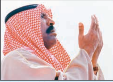
المغفور له بإذن الله تعالى سمو الأمير الوالد الشيخ سعد العبدالله

10 أعوام على رحيل سمو الأمير الوالد أمير الكويت الرابع عشر