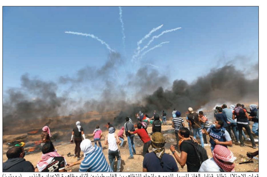
قوات الاحتلال تطلق قنابل الغاز المسيل للدموع باتجاه المتظاهرين الفلسطينيين أثناء مظاهرة الإعداد والندير.

عواصم - وكالات: انتشر عشرات القناصين من الجيش الإسرائيلي خلف السواتر الرملية التي جهزها الجيش في الأسابيع الماضية من أجل قمع مسيرات العودة في مسيرة العودة. وكان مئات الفلسطينيين أدوا صلاة الجمعة في مخيمات العودة الخمسة، القامة على بعد 650 متراً من السياج الأمني الفاصل بين شرقي قطاع غزة وإسرائيل. وقال خطيب الجمعة، الذي أم المصلين في مخيم العودة شرقي مدينة غزة: «سنبقى على العهد، حتى تحرير الأرض الفلسطينية كاملة، وإن كل مؤامرات الأعداء لن تنجح حتى إن أرادوا ضربنا في عمقنا العربي والإسلامي». وعلى صعيد متصل، قام مستوطنون بحرق منزل سكني في نابلس باستخدام مواد مشتعلة من دون وقوع إصابات. وقال المتحدث باسم الحكومة الفلسطينية يوسف الحمود، في بيان، إن «إحراق المخربين المستوطنين لمنزل في قرية دوما جريمة أخرى تضاف إلى سجل الجرائم الفظيعة التي تتحمل مسؤوليتها حكومة الاحتلال». وأضاف الحمود أن «الصمت الدولي الريب، ودعم الرئيس الأميركي دونالد ترامب، لاحتلال إسرائيل يشجع حكومة الاحتلال على تنشيط كل أنزعها، ضمن مخططات العدوان على أبناء الشعب العربي الفلسطيني وأرضه وممتلكاته ومقدساته».