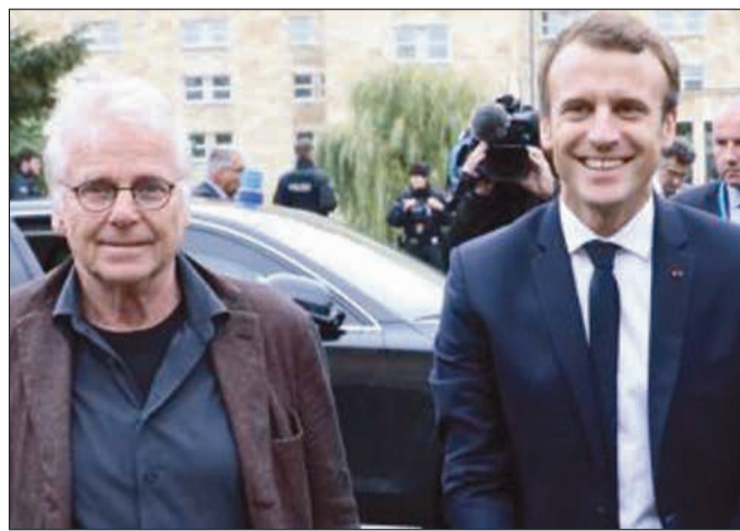
ماكرون مع السياسي دانييل كون بينديت