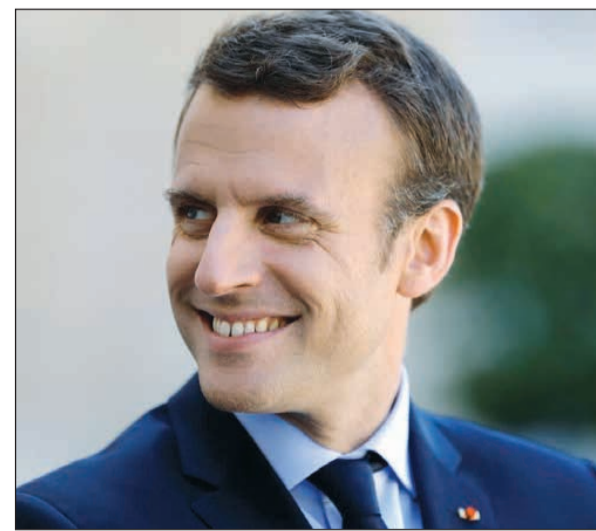
الرئيس الفرنسي إيمانويل ماكرون