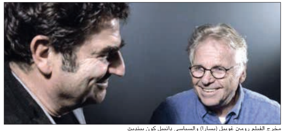
مخرج الفيلم رومين غوبيل (يسارا) والسياسي دانييل كون بينديت

فرنسي إن حوار ماكرون مع الناشطين الإثنيين كان مرتجلا بالكامل والتقط مرة واحدة. ويعرض الفيلم خلال مهرجان كان السينمائي يوم 16 الجاري، على أن يذاع على القناة الفرنسية الخامسة يوم