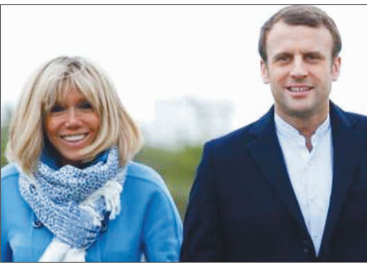
بريجيت مكرتون قبل أن يتزوجها