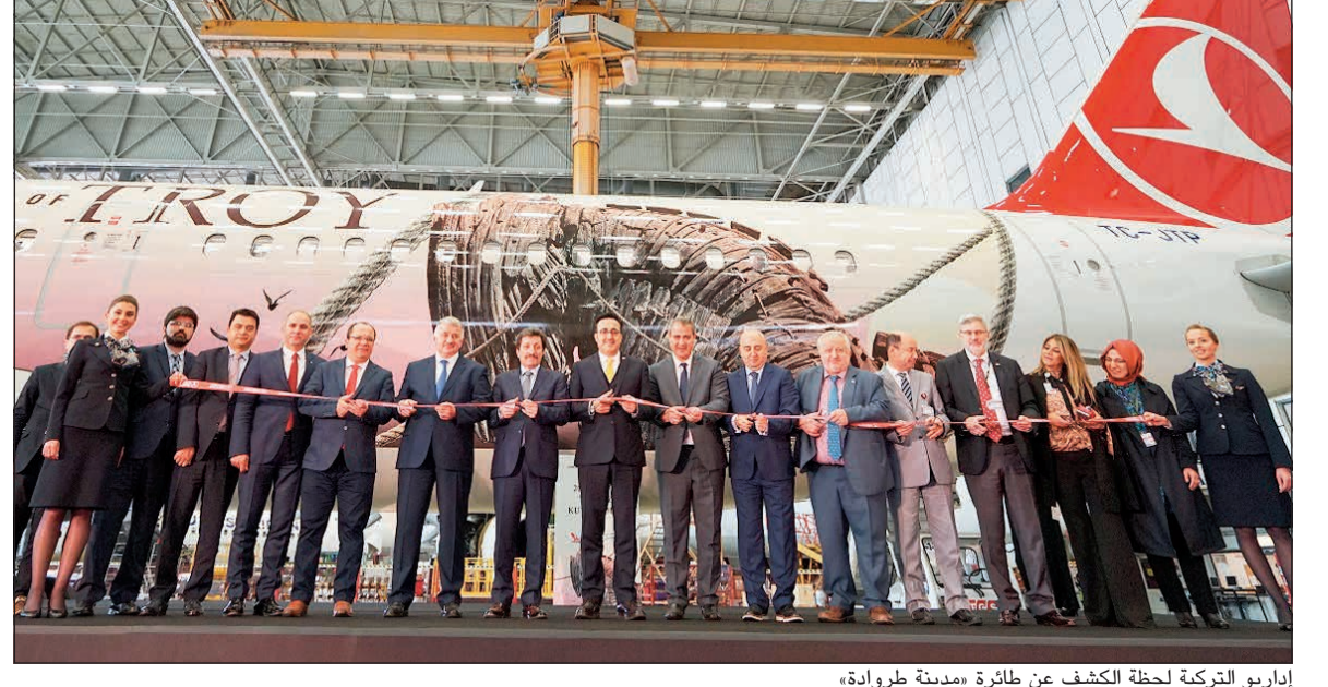
إداريو التركية لحظة الكشف عن طائرة «مدينة طروادة»

أيجي، رئيس مجلس إدارة الخطوط الجوية التركية ورئيس اللجنة التنفيذية في الكلمة التي ألقاها أثناء الاحتفال بإطلاق الطائرة: بصفتنا شركة الخطوط الجوية الوطنية في تركيا، نولي أهمية قصوى للترويج لبلدنا ولقيمنا. مدينة طروادة التي يعود تاريخها إلى عام 3000 قبل الميلاد تنتمي إلى واحدة من الحضارات الفريدة في الأناضول نظراً لتاريخها الذي كان موضوعاً للكثير من الملاحم الشعرية. ونفخر بإسهامنا في تقديم «مدينة طروادة» على متن طائرتنا المصممة وفق نموذج المدينة، والتي ستلحق إلى العديد من الوجهات الدولية التي نوفرها لعملائنا حول العالم. وندعو