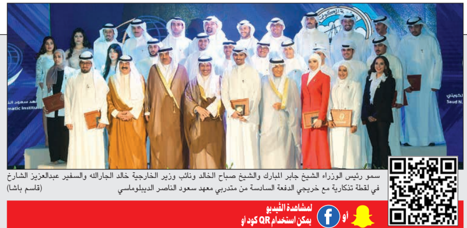
سمو رئيس الوزراء الشيخ جابر المبارك والشيخ صباح الخالد ونائب وزير الخارجية خالد الجارالله والسفير عبدالعزيز الشارح في لحظة تذكارية مع خريجي الدفعة السادسة من متدربي معهد سعود الناصر الدبلوماسية (تقسيم باشا)